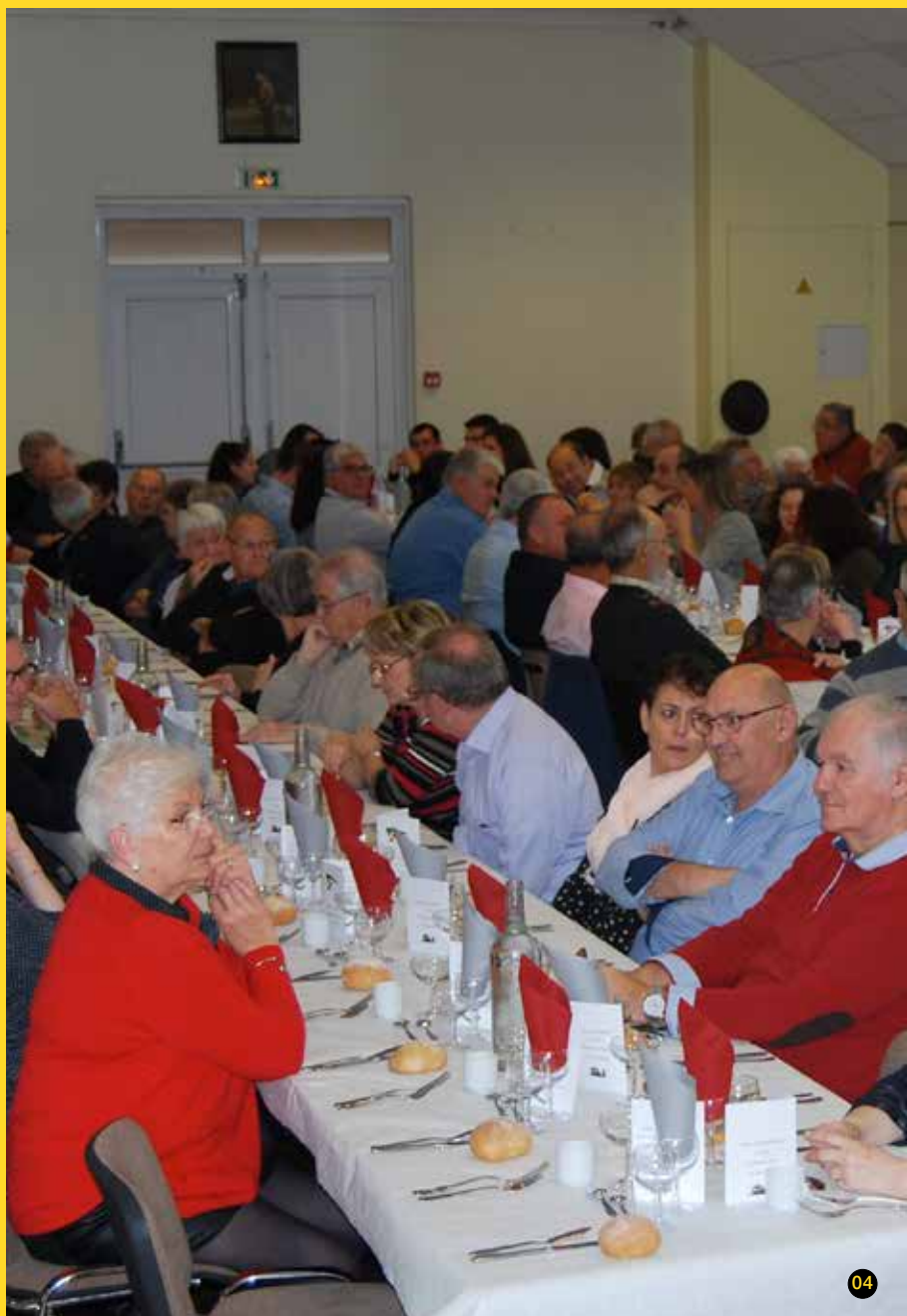
01 Repas des aînés à Saint-Saturnin-sur-Loire