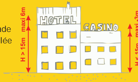
Exemple d'une commune de moins de 10 000 habitants

Sur les immeubles plus grands, la hauteur est limitée au 1/5ème de la hauteur de la façade dans la limite de 6 mètres. La superficie cumulée des enseignes ne peut dépasser 60 m².