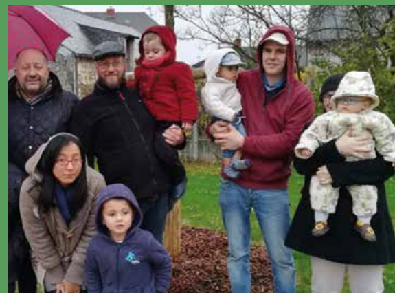
Un arbre a été planté symboliquement pour chaque enfant né en 2017 et en 2018 dans la commune déléguée des Alleuds. Cette cérémonie conviviale en présence d'élus et des bébés a eu lieu fin novembre et a permis de planter au total 22 nouveaux arbres.