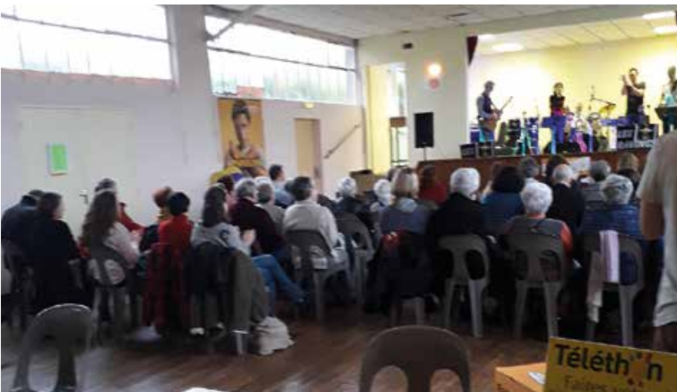
De nombreuses associations locales se sont mobilisées pour organiser le téléthon de Coutures qui a séduit le public, notamment par des repas partagés et des animations musicales de qualité. Quelques 3 222 € ont ainsi été collectés pour la bonne cause.