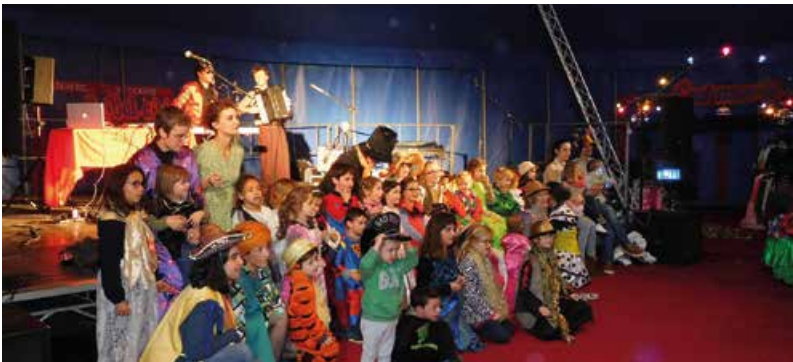
Le «Bal à Mômes» et les différents concerts et spectacles organisés sous le grand chapiteau ont connu une bonne fréquentation les 7 et 8 décembre derniers, place du Général de Gaulle à Brissac Quincé.