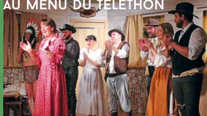
La pièce de théâtre organisée salle René Besson dans le cadre du Téléthon a connu un joli succès.

Le 29 e téléthon de Vauchrétien a aussi pris la forme d'un loto et d'un concours de palets : 3 400 € ont été collectés par les différentes animations proposées par les associations valchristinoises.