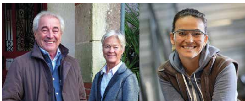
Rapprocher les personnes disposant de chambres libres et les jeunes en recherche de logement, voilà l'enjeu de ce nouveau service.

La Communauté de Communes Loire Layon Aubance propose un nouveau dispositif d'hébergement temporaire chez l'habitant pour les 15-30 ans en recherche d'un logement sur le territoire pour un stage, une formation, un emploi, un apprentissage... Si vous disposez d'un logement ou d'une chambre disponible, même ponctuellement, et si vous souhaitez participer au réseau d'hébergeurs Loire Layon Aubance, n'hésitez pas à contacter l'association Habitat Jeunes David d'Angers. Le tarif maximum est de 15 € la nuitée (ou avec un plafond mensuel de 250 € à 270 €).