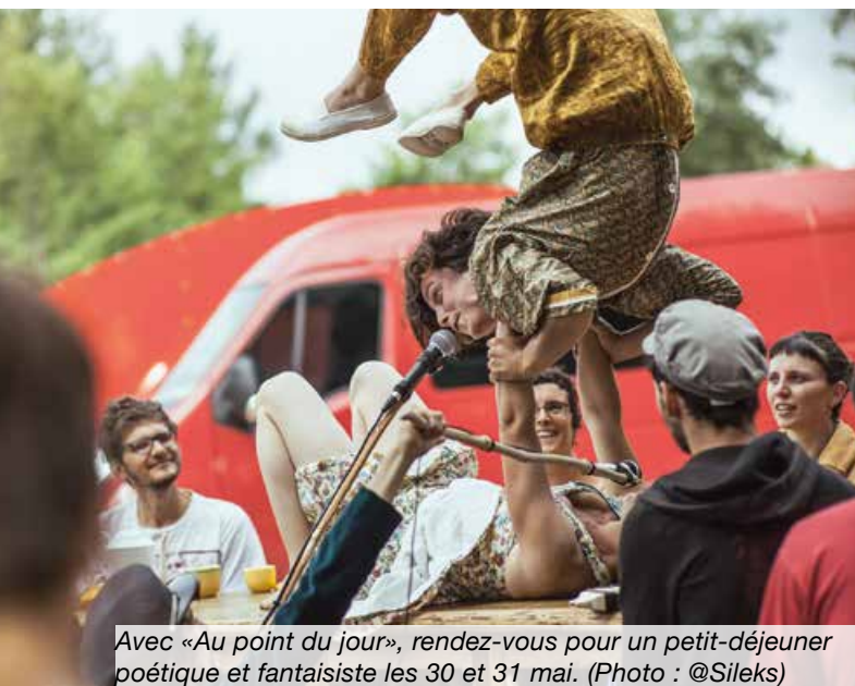
Avec «Au point du jour», rendez-vous pour un petit-déjeuner poétique et fantaisiste les 30 et 31 mai.

02 41 54 06 44 et sur www.villages-en-scene.fr/