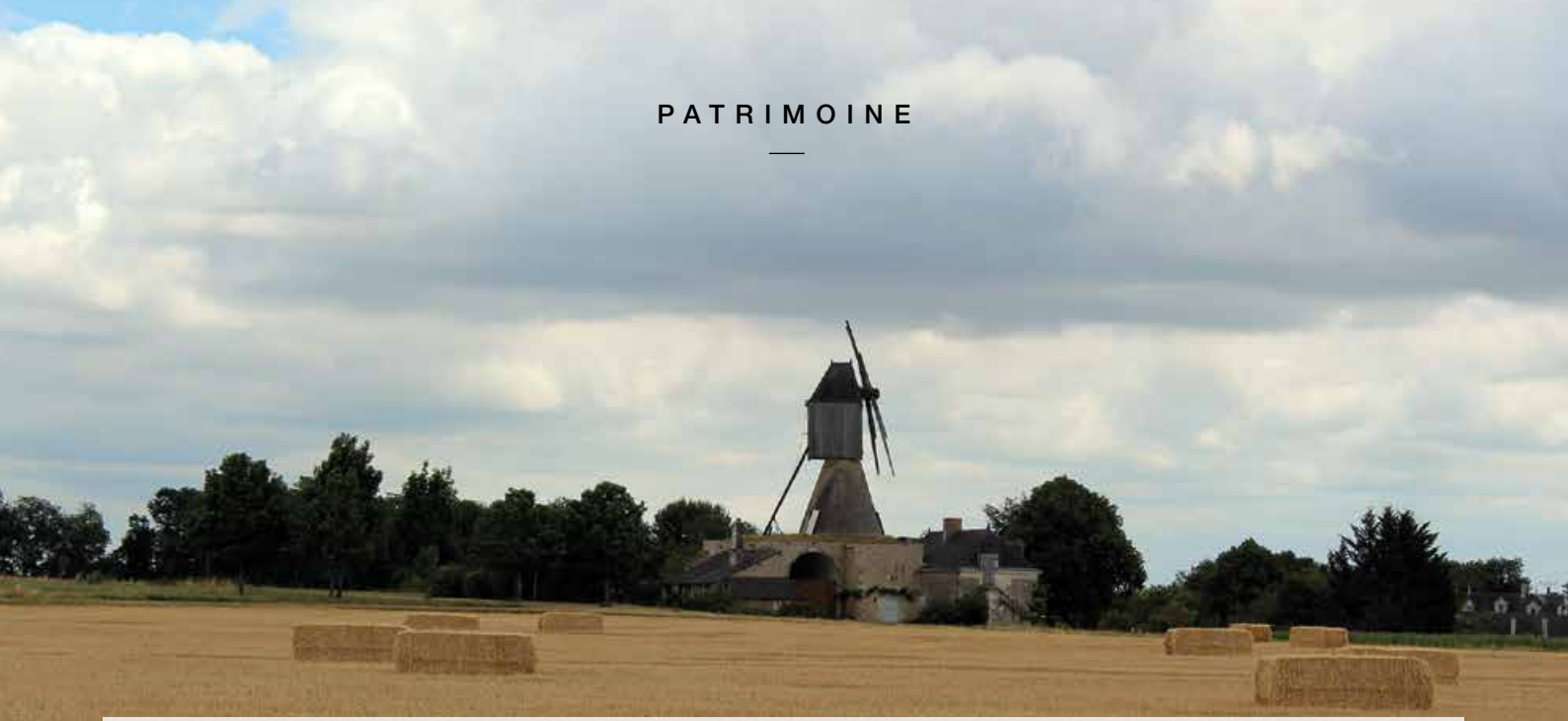
Les moulins à vent, des éléments emblématiques du paysage de Brissac Loire Aubance, comme ici celui du Bourg Dion.