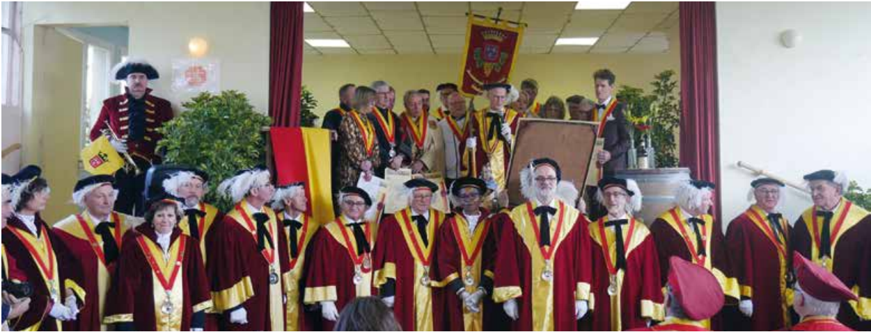
La confrérie des Fins Gousiers a intronisé ses nouveaux membres lors d'un week-end joyeux et festif qui s'est tenu à Coutures et dans les villages alentours, les 18 et 19 janvier derniers.