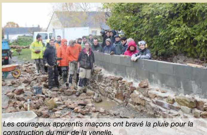
Les courageux apprentis maçons ont bravé la pluie pour la construction du mur de la venelle.

L'aménagement du site de «La Forge» dans le centre bourg de Saint-Saturnin-sur-Loire a prévu la création d'une venelle permettant de rejoindre l'école. Les tra-