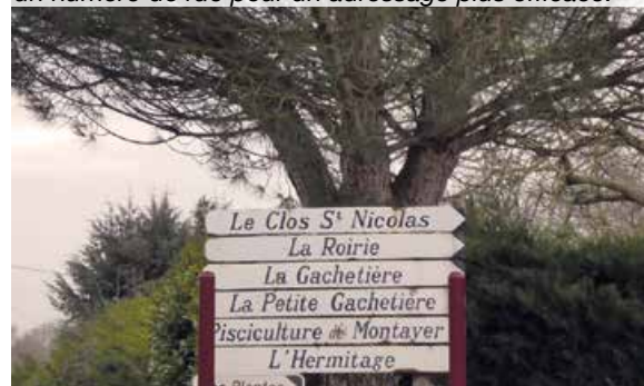
De nombreux lieux-dits se verront attribuer un nom et un numéro de rue pour un adressage plus efficace.

ainsi il arrive que deux habitations, bien que voisines, ne soient pas raccordées dans le même temps. Les logements concernés par le nouvel adressage seront informés par courrier de la commune, de la nouvelle adresse à communiquer à leurs interlocuteurs.