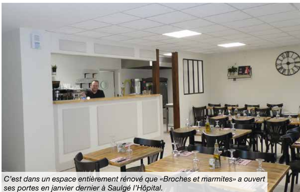
C'est dans un espace entièrement rénové que «Broches et marmites» a ouvert ses portes en janvier dernier à Saugé L'Hôpital.

midis et le vendredi soir, ainsi que sur réservation pour des groupes le week-end. Nous proposons un menu ouvrier chaque midi et notre spécialité est la rôtisserie, ce qui me permet aussi de proposer des plats à emporter», explique le restaurateur qui a ouvert les portes de son nouvel établissement le 8 janvier dernier. Contact : 06 61 25 32 77.