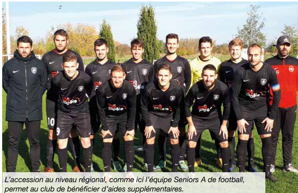
L'accession au niveau régional, comme ici l'équipe Seniors A de football, permet au club de bénéficier d'aides supplémentaires.

Après le transfert de la compétence «sport» de la Communauté de Communes à la commune l'an passé, la municipalité a repris en direct la gestion de l'attribution des subventions aux clubs sportifs locaux. Pour un subventionnement transparent et au plus juste des différentes associations sportives, un mode de calcul des subventions a été mis en place par la commission sport. Ce mode de calcul tient compte du nombre de licenciés mais aussi de leur âge, l'idée étant d'encourager la pratique sportive des plus jeunes. Chaque association qui dépose un dossier de demande de subvention doit aussi donner un certain nombre d'informations sur son fonctionnement. L'embauche d'éducateurs professionnels (avec les frais que cela implique) est, par exemple, prise en compte.