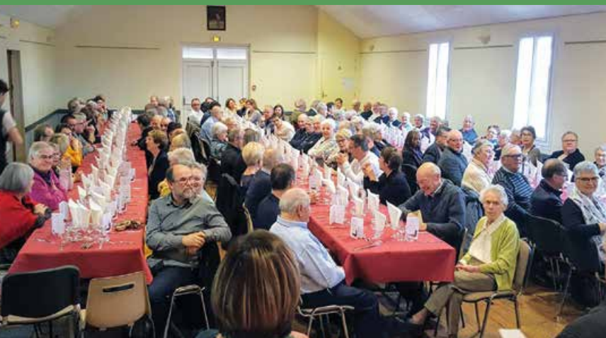
Convivialité et bonne ambiance étaient au menu du repas des aînés qui a eu lieu le 24 novembre dernier.