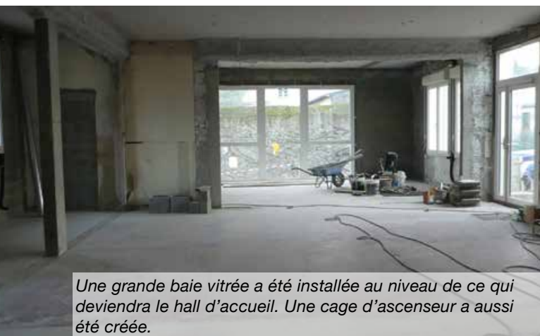
Une grande baie vitrée a été installée au niveau de ce qui deviendra le hall d'accueil. Une cage d'ascenseur a aussi été créée.