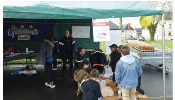
De nombreuses associations ont pris part à ces deux journées festives comme les Jeunes Sapeurs Pompiers qui ont proposé de multiples animations et des initiations au secourisme.