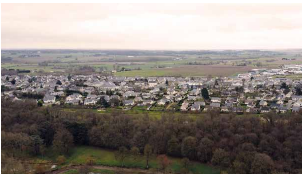
Le diagnostic territorial fait le bilan du parc de logements et de l'utilisation de l'espace.

Les élus et le cabinet Urba Ouest vont désormais travailler sur le PADD, le Projet d'Aménagement et de Développement Durable. Ce PADD va définir les