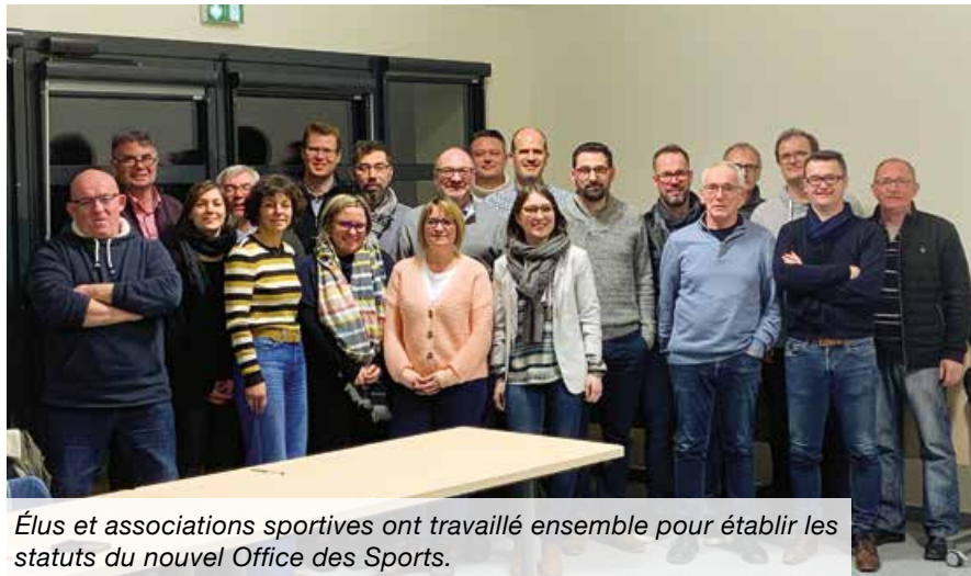
Élus et associations sportives ont travaillé ensemble pour établir les statuts du nouvel Office des Sports.