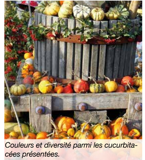
Couleurs et diversité parmi les cucurbitacées présentées.