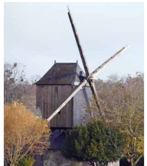
Le moulin de Patouillet, l'un des deux derniers moulin sur pivot en Anjou.

Le moulin de Bourg Dion a été construit vers 1840, et, tout comme celui de Patouillet, il est inscrit à l'inventaire des Monuments Historiques. Propriété privée, ce moulin à pivot sur cavier est un moulin caractéristique de l'Anjou. Ce type de moulin est présent notamment dans le Saumurois. Il se compose d'une maçonnerie conique, construite au-dessus