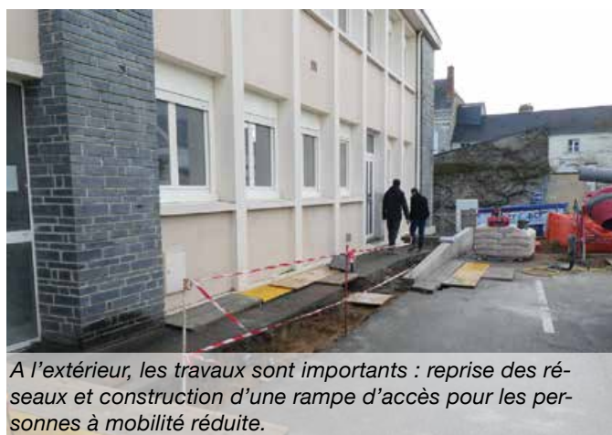
A l'extérieur, les travaux sont importants : reprise des réseaux et construction d'une rampe d'accès pour les personnes à mobilité réduite.

Les corps de métiers se succèdent et les contours de la future Maison France Services à Brissac-Quincé prennent forme. Une grande baie vitrée a été installée dans le vaste hall d'accueil qui disposera d'un nouvel ascenseur et de bornes multimédias. Les cloisons de plusieurs bureaux ont aussi été montées. L'étage a également été entièrement remanié et quatre grands bureaux sont désormais cloisonnés. L'un d'eux, spécialement équipé, sera réservé aux permanences de la Protection Maternelle et Infantile (PMI) pour les consultations. A l'extérieur du bâtiment, tous les réseaux ont été renouvelés et une rampe d'accès pour personne à mo-