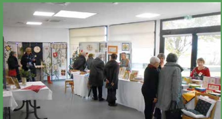
L'association Loisirs et détente, section Atelier aux Aiguilles Variées, a proposé une exposition de grande qualité les 23 et 24 novembre derniers dans la salle des fêtes de Chemellier.