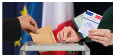
La pièce d'identité est obligatoire pour voter.

Sans une pièce d'identité valide, il ne vous sera pas possible de voter, même si vous êtes connu(e) des personnes du bureau de vote.