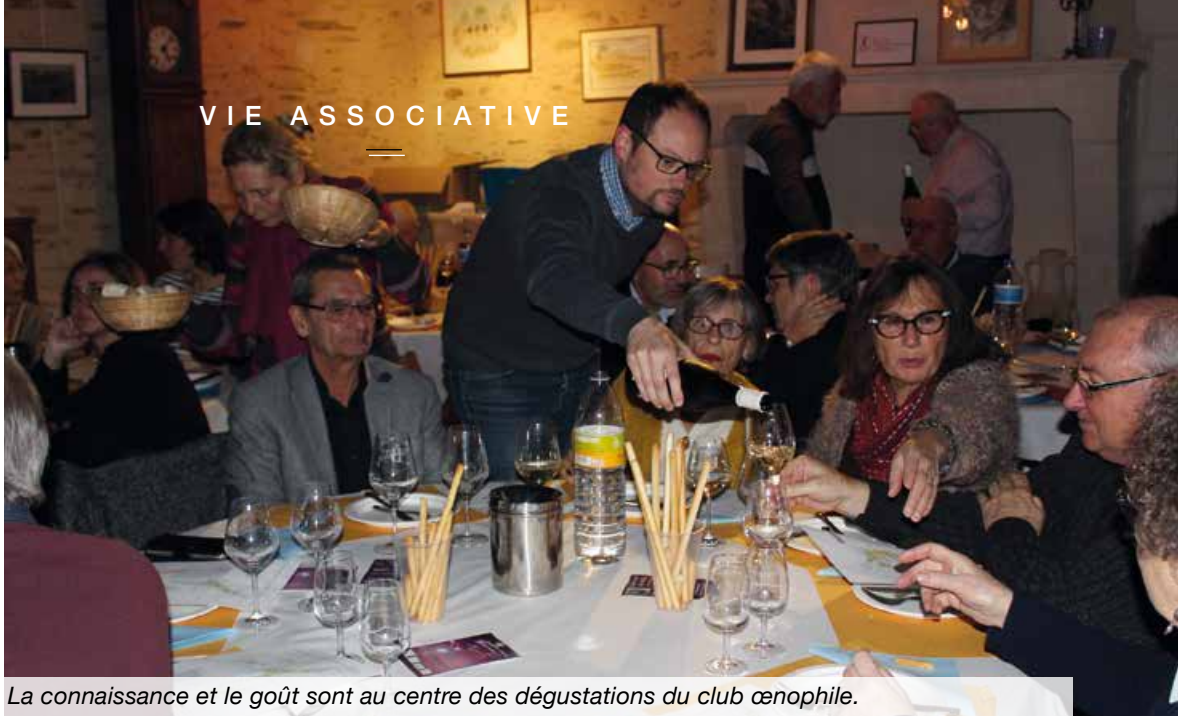
La connaissance et le goût sont au centre des dégustations du club œnophile.