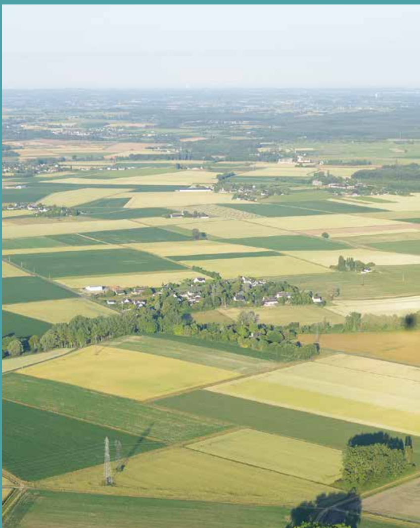
Vue du ciel, la mosaïque des cultures de céréales du côté de Chemellier et Charcé.