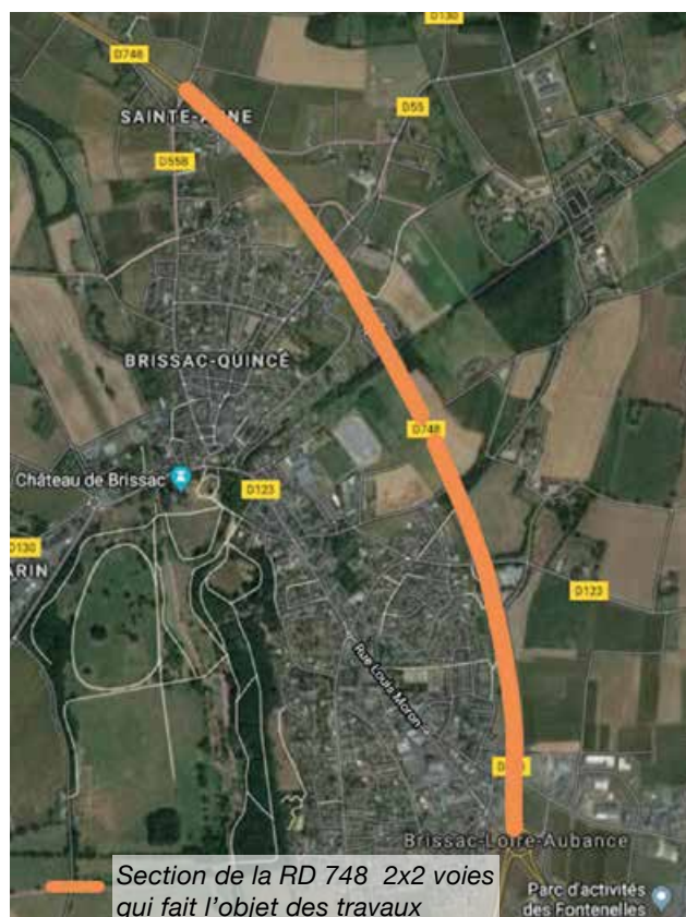
Section de la RD 748 2x2 voies qui fait l'objet des travaux

Les services du Département et l'Agence Technique Départementale de Doué la Fontaine s'emploieront à minimiser la gêne occasionnée du fait de ces travaux.