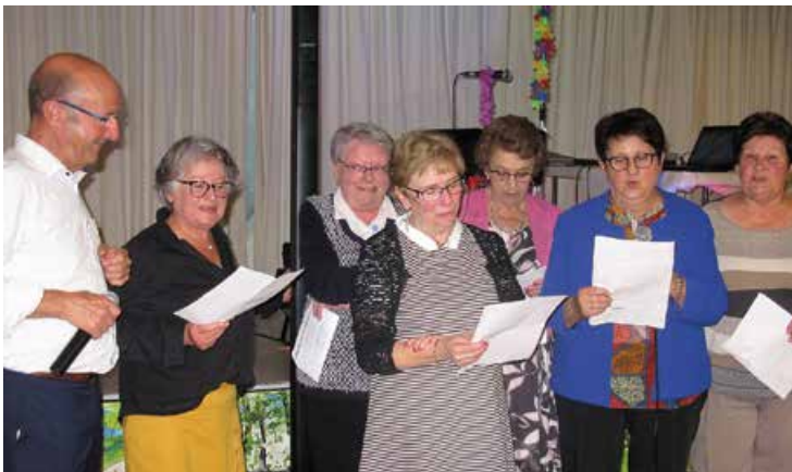
Chanteurs et chanteuses ont contribué à la bonne ambiance lors du repas des aînés de Brissac Quincé organisé par le CCAS et qui a eu lieu le 16 octobre dernier, salle du Tertre.