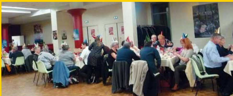
De nombreuses animations et une belle décoration sur la thématique du cinéma ont contribué à la convivialité de ce rendez-vous du nouvel an.