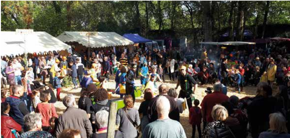
Les Hortomnales et les désormais célèbres réalisations de courges en tous genres ont réuni des visiteurs par milliers les 26 et 27 octobre dernier.