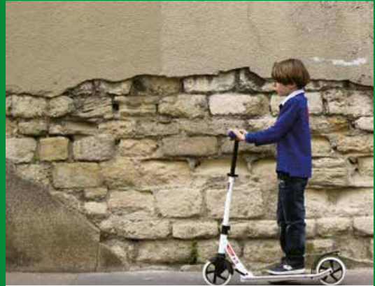
La vitesse sur le trottoir est limitée à 6km/h.

Les utilisateurs de rollers, skateboards ou trottinettes (sans moteur), les vélos de petite taille utilisés par des enfants de moins de 8 ans, sont considérés comme des piétons et doivent rouler sur le trottoir. Tous doivent respecter les feux tricolores réservés aux piétons, emprunter les passages protégés, rouler à allure modérée (6km/h).