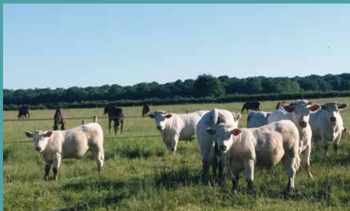
Un cheptel varié. À Brissac Quincé, vaches allaitantes et chevaux destinés aux concours hippiques se côtoient dans un même élevage.

marâcher, Yves Aguila élève des brebis solognotes, une espèce rustique aujourd'hui protégée dont les agneaux sont bruns à la naissance. « Mon troupeau compte 60 brebis. Il a la particularité d'être proposé en éco-pâturages aux collectivités ou entreprises, j'ai par exemple des brebis qui pâturent à Saumur, ou du côté d'Angers... Cette année j'ai vendu peu d'animaux pour la consommation car les bêtes sont cédées à d'autres élevages pour leur qualité génétique », explique Yves Aguila.