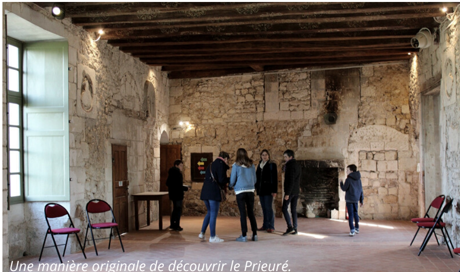
Une manière originale de découvrir le Prieuré.

En famille ou entre amis, le public est venu en nombre mercredi 11 mars pour mener l'enquête du trésor dérobé au Prieuré de Saint-Remy-la-Varenne. Trois séances étaient organisées à 14h, 15h30 et 17h. Munies de tablettes, les équipes ont mené une enquête leur permettant de visiter tous les recoins du Prieuré. Trois autres séances sont prévues le 1er avril (sous réserve des contraintes actuelles liées à l'organisation d'événement. Plus d'informations seront données prochainement.)