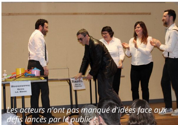
Les acteurs n'ont pas manqué d'idées face aux défis lancés par le public !

La troupe des "Imposteurs" avait rendez-vous à Vauchrétien, samedi 7 mars, salle René Besson, pour 2 représentations de théâtre d'improvisation. Le spectacle "Les receleurs" donné à 17h a réuni quelques 70 personnes qui ont pu proposer différents éléments de scènes de crime avec les lesquels les