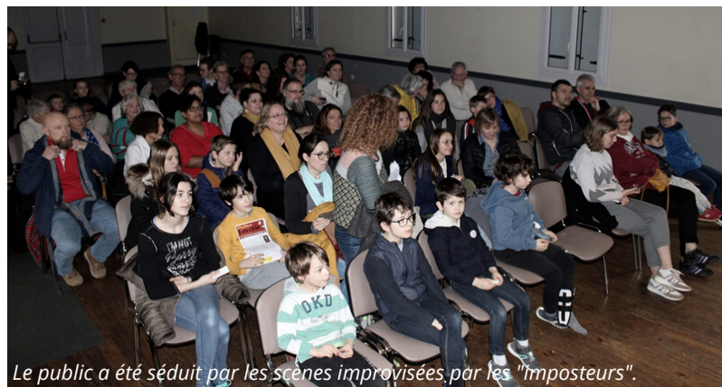
Le public a été séduit par les scènes improvisées, par les "imposteurs".

La troupe des "Imposteurs" avait rendez-vous à Vauchrétien, samedi 7 mars, salle René Besson, pour 2 représentations de théâtre d'improvisation. Le spectacle "Les receleurs" donné à 17h a réuni quelques 70 personnes qui ont pu proposer différents éléments de scènes de crime avec les lesquels les