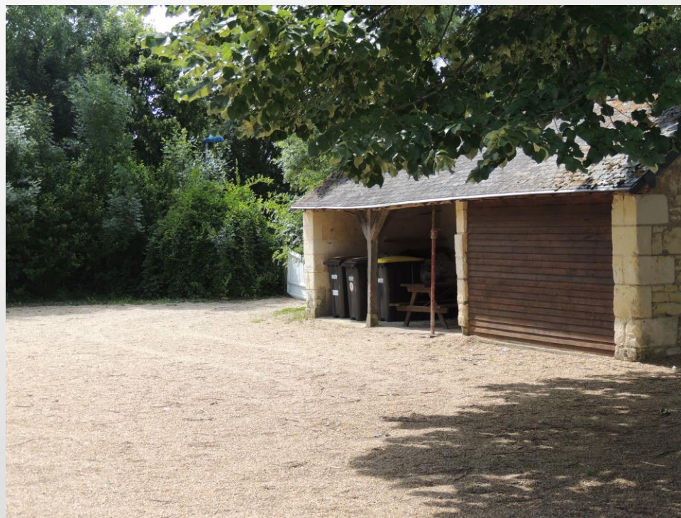
ESPACE EXTERIEUR CLOS

Chemin de la Planche - Saulgé l'Hôpital 49320 BRISSAC LOIRE AUBANCE