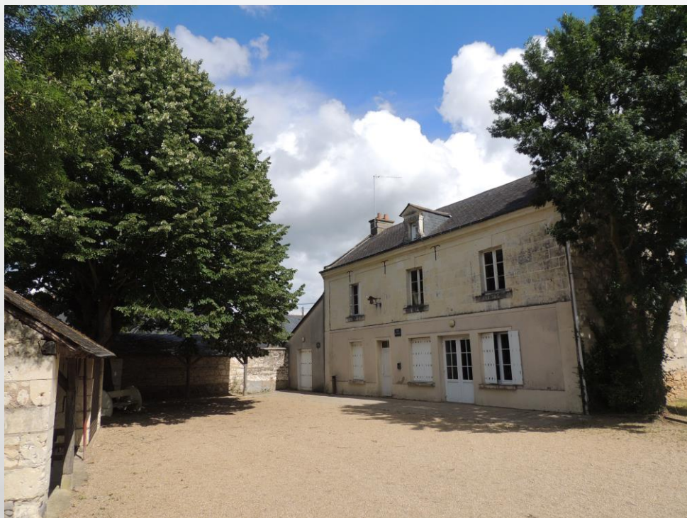
SALLE DU PRÉAU

Chemin de la Planche - Saulgé l'Hôpital 49320 BRISSAC LOIRE AUBANCE