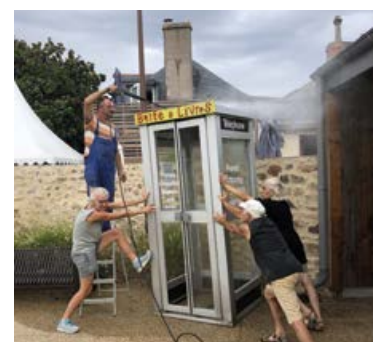
L'heure du nettoyage !

A près un sérieux décapage, la boîte à livres qui était jusqu'alors place de l'église a intégré la place de la Forge dans le centre Bourg, derrière le Bistrot. Cette opération a pu être réalisée grâce à l'association les Satur'Zik et +. Bravo !