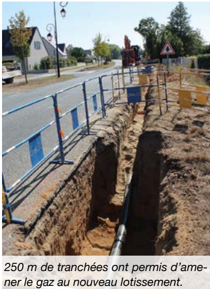
250 m de tranchées ont permis d'amener le gaz au nouveau lotissement.

Les réseaux se mettent en place, parcelle par parcelle et la voirie se dessine. Par exemple, mi-septembre, des tranchées ont été creusées sur 250 mètres de longueur et plus d'un mètre de profondeur depuis la rue Raphaël Lecuit afin de mettre en place la canalisation de gaz qui alimentera les maisons de ce nouveau lotissement. Au total ce terrain d'une surface de 3,1 hectares permettra de voir sortir de terre 64 logements répartis en : 12 logements en habitat intermédiaires par Maine-et-Loire Habitat, 40 logements individuels libres sur des terrains à bâtir, 12 logements individuels groupés répartis en deux programmes.