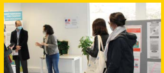
Les agents France services présenteront les nombreux services proposés sur place.