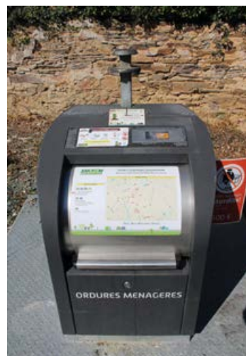
L'apport d'un sac d'ordures ménagères en apport volontaire peut permettre de décaler une levée et donc de diminuer les coûts.

Si vous souhaitez plus de renseignements sur les composteurs, vous pouvez contacter le SMITOM au 02 41 59 61 73.