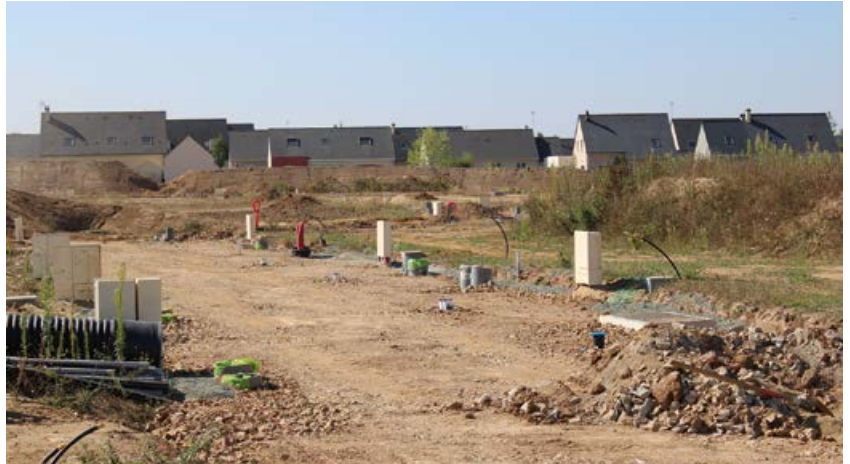
Les connexions des différentes parcelles sont en cours avant les travaux de voirie.

Les travaux qui permettront de voir émerger le nouveau lotissement de la Pierre Couchée ont bien avancé ces derniers mois. La viabilisation du site démarrée en février comprend la réalisation de l'ensemble des travaux de voirie, réseaux, bassins de rétentions, d'espaces verts et installations diverses destinées à répondre aux besoins des futures entreprises à l'intérieur de l'opération.