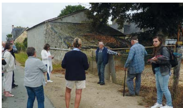
Les bénévoles mènent un important travail sur le terrain.