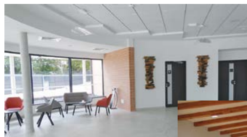
Le vaste hall d'accueil.

Inauguré le 28 juin, le crématorium de Brissac Loire Aubance a été mis en service quelques jours plus tard. Les premières familles qui se sont rendues au crématorium ont salué la qualité de cet équipement. Le grand hall d'accueil, la salle de cérémonie d'une capacité de 120 places ainsi que la salle de retrouvailles (à disposition des familles qui le souhaitent pour organiser une collation) permettent de disposer de toutes les commodités pour les cérémonies, dans une ambiance apaisée, propice au recueillement.