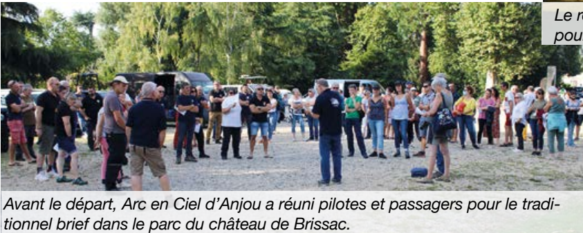
Avant le départ, Arc en Ciel d'Anjou a réuni pilotes et passagers pour le traditionnel brief dans le parc du château de Brissac.