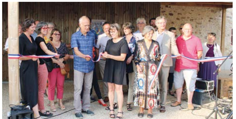
La place de la Forge qui jouxte le nouveau bâtiment structurant du centre bourg a été inaugurée le 17 septembre dernier, avant un petit concert du groupe «L'Arnaque».