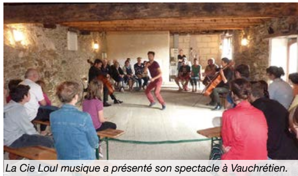
La Cie Loul musique a présenté son spectacle à Vauchrézien.