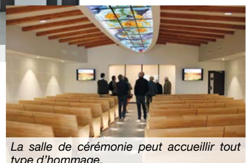
La salle de cérémonie peut accueillir tout type d'hommage.