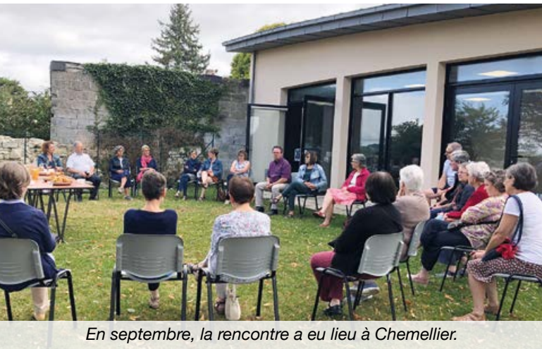
En septembre, la rencontre a eu lieu à Chemellier.

L'amélioration de la situation sanitaire au début de l'été a permis aux élus de reprendre les rencontres sur le terrain avec les habitants. Le 3 juillet, c'est sur la terrasse du Mont Rude à Saint-Saturnin/Loire que les élus ont pu échanger avec les citoyens. Le 11 septembre, ils étaient à Chemellier pour échanger sur