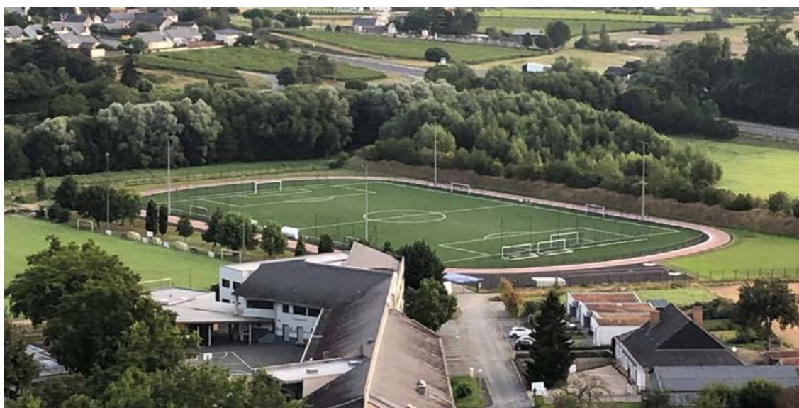
Les cheminements vers les pistes et le terrain synthétique vont être améliorés et les accès sécurisés.

La première phase des travaux extérieurs du complexe du Marin est terminée depuis fin juillet. Elle a permis la mise en place du terrain de football synthétique, de la piste d'athlétisme cendrée rouge avec un couloir supplémentaire, les espaces de sauts en longueur, en hauteur et l'espace de lancer. Les clubs sportifs et les scolaires ont pu démarrer l'année scolaire dans les meilleures conditions.