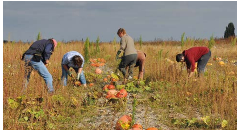
Les Hortomnales se préparent dans les champs dès le printemps.