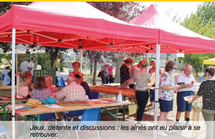
Jeux, détente et discussions : les aînés ont eu plaisir à se retrouver.