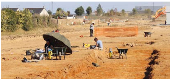
Ces travaux permettent une meilleure connaissance de l'époque romaine.

Des fouilles archéologiques préventives se terminent mi-octobre sur une partie du clos de la Pierre couchée. Ces fouilles complémentaires ont été demandées par le lotisseur et concernent notamment un puits. 4 à 5 archéologues de l'entreprise Eveha de Rennes se sont relayés pour procéder à des relevés, des photographies, des mesures avant que ces éléments de l'époque romaine ne soient enfouis par les travaux à venir. Les archéologues ont aussi relevé les emplacements de plusieurs poteaux de bois qui soutenaient vraisemblablement une palissade en bois dont l'usage reste à définir.