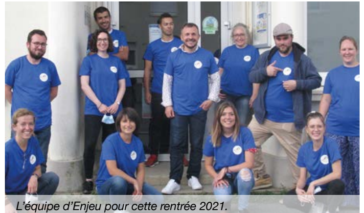
L'équipe d'Enjeu pour cette rentrée 2021.

- Pour les adultes et les familles : clubs couture, multisports, rando vélo ou pédestre, gym douce... de nombreuses nouvelles activités pour les adultes de 18 à 99 ans ont démarré depuis le 20 septembre.