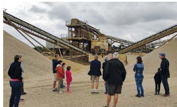
La sablière des Alleuds attire toujours la curiosité des visiteurs.