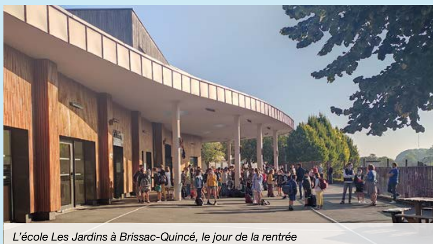
L'école Les Jardins à Brissac-Quincé, le jour de la rentrée

N'oubliez pas de réserver (et d'actualiser si nécessaire)