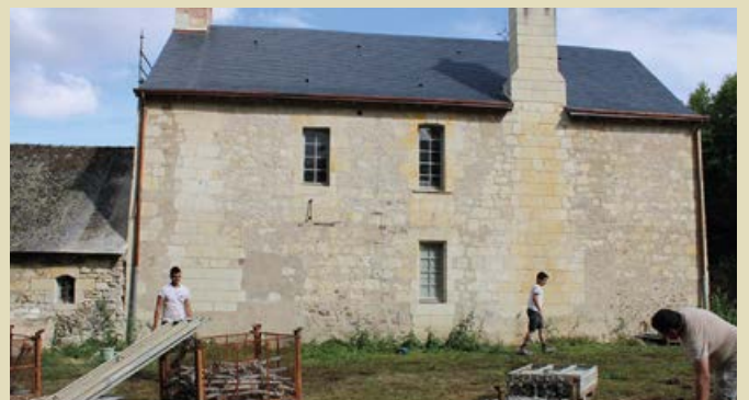
La première phase de sauvegarde de l'édifice s'est achevée en septembre avec le démontage des échafaudages.

La première phase de travaux de restauration du presbytère de Charcé s'est achevée en septembre et a permis la rénovation extérieure du corps de logis, de l'escalier et de l'aile ainsi que des travaux de couverture. Un appel d'offres sera lancé cet automne pour une deuxième tranche qui concernera les communs, également pour des travaux de couverture et de consolidation des maçonneries qui permettront de sauvegarder durablement l'édifice et d'envisager ensuite son aménagement intérieur.