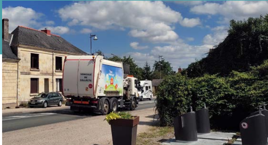
La redevance incitative vise à responsabiliser davantage les habitants sur la question de la production de déchets.

Les services du SMITOM Sud-Saumurois ne changent pas en 2022 : la collecte a lieu tous les