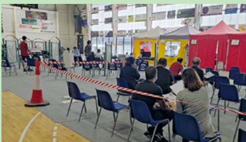
Le centre a fermé ses portes le 31 août.

Le centre de vaccination installé au complexe du Marin par la Communauté de Communes Loire Layon Aubance a fermé ses portes le 31 août, non sans avoir proposé, dans les dernières semaines, une vaccination sans rendez-vous pour les 12-17 ans. Deux journées complémentaires ont été prévues à la salle du Tertre en septembre pour cette tranche d'âge afin de finaliser leur schéma vaccinal. Le centre a bien fonctionné, et 80% des 12-17 ans du secteur sont vaccinés. Au total 56 000 actes de vaccination ont été réalisés entre début avril et fin août.