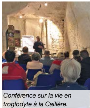
Conférence sur la vie en troglodyte à la Caillère.