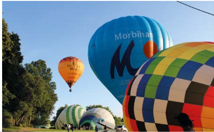
Le retour des ballons en nombre dans le ciel, les 20 et 21 août, pour le plus grand plaisir des habitants.

L'association Arc en Ciel d'Anjou a réussi à maintenir son événement des Montgolfiades cet été, les 20, 21 et 22 août. Cette manifestation avait été annulée en 2020 en raison de la Covid, et en 2019 en dernière minute en raison de la météo. Pour cette édition, le format a été réduit du fait des restrictions sanitaires, mais la magie, elle, a entièrement opéré ! Le public n'a pu être accueilli dans le parc du château comme à l'accoutumée, mais nombreux ont été les habitants à profiter du spectacle depuis leur balcon ou jardin. Plus d'une douzaine de ballons ont pu parcourir la commune dans de multiples directions grâce à plusieurs départs entre vendredi soir et dimanche matin, pour le plus grand plaisir des pilotes et de leurs passagers.