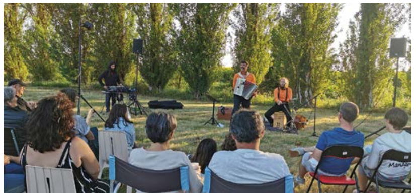
Les Evadés étaient présents le 29 juillet au plan d'eau pour la 5 ème soirée du festival le Sous Marin organisé par la compagnie du Poulpe.

Plusieurs concerts et représentations de théâtre ont eu lieu cet été au plan d'eau de Chemellier. Un environnement apaisant, propice à l'accueil de spectacles. Le 29 juillet, le festival du Sous Marin a accueilli «Les évadés» et Pompas Solo. La Soirée de clôture du festival le Sous-Marin a elle aussi finalement été organisée en dernière minute au plan d'eau, le 12 août, où ont joué Akatot'M et William & Stanley. Sur chacune de ces dates, la Compagnie du Poulpe organisatrice de ce festival, a proposé un marché des artisans et/ou produits locaux.