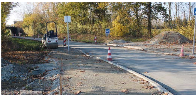
De nouveaux trottoirs ont été créés pour sécuriser cette zone parfois très fréquentée, notamment lors de cérémonies au crématorium.

Des travaux d'aménagement et de sécurisation ont été menés à l'entrée de Brissac-Quincé, route de Charcé (près du crématorium), au niveau du carrefour vers la Clergeauderie et entre le carrefour et le pont qui passe sous la voie express. Ces travaux de voirie ont notamment permis l'aménagement de trottoirs et un rétrécissement de la voie afin de limiter la vitesse dans cette zone dont la fréquentation a augmenté avec l'organisation de cérémonies au crématorium.