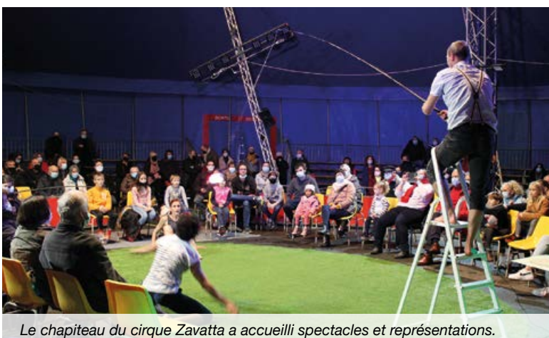
Le chapiteau du cirque Zavatta a accueilli spectacles et représentations.

D éplacé en dernière minute salle de l'Aubance en raison des contraintes sanitaires, D'hiver et d'étoiles a offert un beau week-end de fêtes et des rêves à tous les habitants. Des bals insolites, un superbe spectacle de cirque, des chants et de la musique grâce à Chant'Aubance, à la chorale du collège Saint-Vincent et à l'école de musique, des animations avec les Perchés, le père Noël, une mascotte sympa-