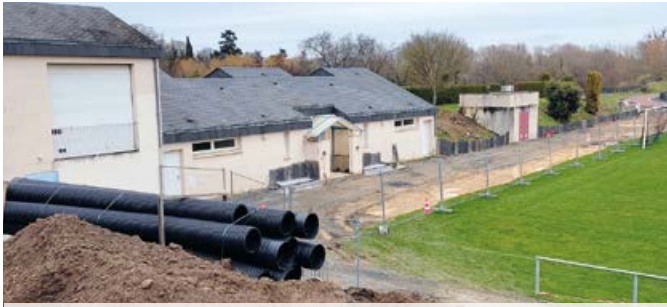
Les tranchées laisseront bientôt place à de larges chemins d'accès.

La zone du Marin à Brissac-Quincé, véritable cœur sportif pour tous les Brilaubancais poursuit sa transformation. Après la création du terrain synthétique et des pistes et aires de lancer pour l'athlétisme, ce sont les cheminements qui sont en train d'être rénovés. Ils permettront une meilleure circulation des sportifs et une meilleure sécurisation des lieux grâce à un seul accès pour les scolaires et clubs sportifs. Ces travaux permettent de refaire les réseaux sous terrains ainsi que les abords et talus des espaces verts. L'extérieur des vestiaires sera aussi rénové.