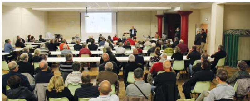
Après la présentation, les habitants ont pu questionner les élus.