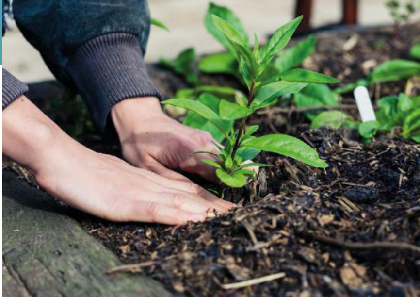
Une petite surface mise en valeur, un grand pas pour l'embellissement de la commune !

Le permis de végétaliser : une occasion unique pour les habitants de devenir acteur de leur cadre de vie !