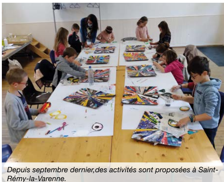
Depuis septembre dernier, des activités sont proposées à Saint-Rémy-la-Varenne.