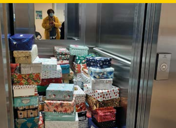
Plus de 200 colis ont été offerts par les habitants.