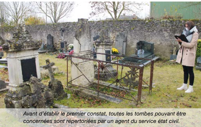
Avant d'établir le premier constat, toutes les tombes pouvant être concernées sont répertoriées par un agent du service état civil.

Conformément à la réglementation, il a été procédé le jeudi 2 décembre dernier, à 14h à la constatation de l'état dans lequel se trouve chaque concession concernée. Un procès-verbal de ce constat a été rédigé.