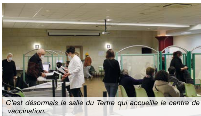
C'est désormais la salle du Tertre qui accueille le centre de vaccination.

Le vaccin Pfizer sera administré uniquement le samedi. Réservation en ligne uniquement sur : www.doctolib.fr