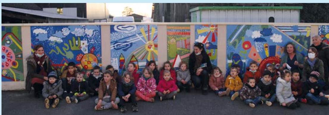
L'école des Alleuds dispose d'une nouvelle fresque réalisée par les élèves.

Une amélioration qui en appellera d'autres puisqu'un «parcours de billes» en béton a été créé par un papa d'élèves dans la cour de l'école pour améliorer le cadre de jeu des enfants. Bravo !