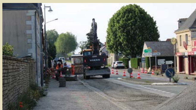
Le retour des travaux aux Alleuds nécessitera souvent un alternat de circulation.

La circulation sera perturbée sur la RD761 aux Alleuds du 11 janvier au 22 avril 2022.