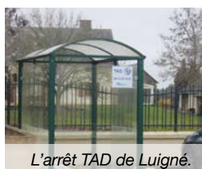
L'arrêt TAD de Luigné.

- Réservations : au 02 41 22 72 90 du lundi au vendredi jusqu'à 16h et par courriel : tad49@paysdelaloire.fr