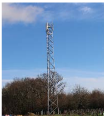
Le déploiement des antennes est géré par les opérateurs.

Pouvoir téléphoner de partout, voilà l'enjeu de la suppression des zones blanches qui doivent disparaître de France au plus tard en 2027. C'est une disposition légale à laquelle les opérateurs de téléphonie mobile, (Orange, SFR, Bouygues et Free,) doivent se soumettre et la commune n'a pas le pouvoir de s'opposer à une implantation d'antenne. L'opérateur reste seul décisionnaire de l'opération. La commune n'est consultée que dans le cadre de l'instruction d'une déclaration préalable. Quand elle a connaissance des projets, la commune incite les opérateurs à travailler ensemble et à n'implanter