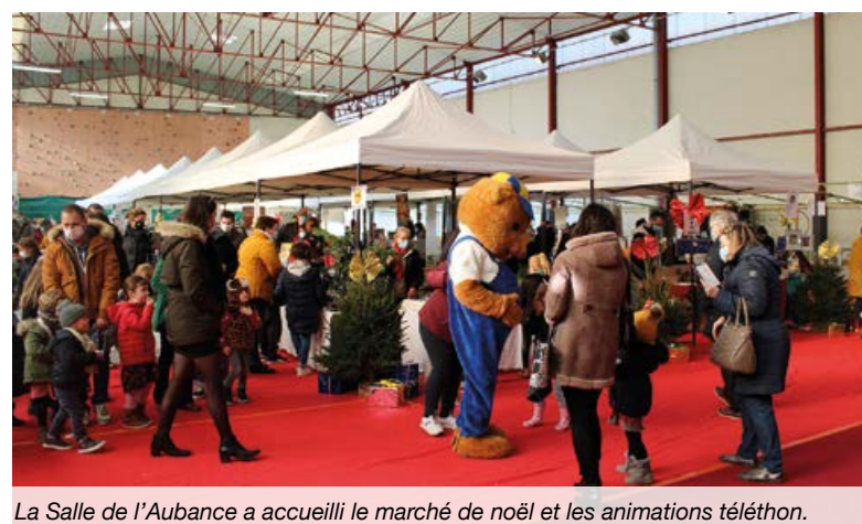
La Salle de l'Aubance a accueilli le marché de Noël et les animations téléthon.

D éplacé en dernière minute salle de l'Aubance en raison des contraintes sanitaires, D'hiver et d'étoiles a offert un beau week-end de fêtes et des rêves à tous les habitants. Des bals insolites, un superbe spectacle de cirque, des chants et de la musique grâce à Chant'Aubance, à la chorale du collège Saint-Vincent et à l'école de musique, des animations avec les Perchés, le père Noël, une mascotte sympa-