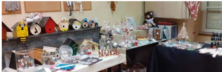
L'exposition des résidents du Pont de Varenne.

marché de Noël de l'établissement. Un fort coup de vent ayant détruit une grande partie des barnums installés dans le parc la veille de l'événement.