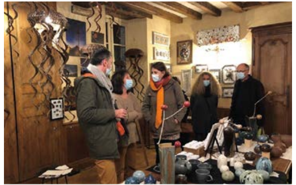
Cette première exposition a été appréciée.

C'est dans l'ancienne salle du Conseil Municipal de la Mairie déléguée de Saint Rémy la Varenne que l'association Parcours Croisés a réalisé sa première exposition de créateurs locaux du 9 au 22 décembre. C'était aussi l'occasion d'officialiser une convention de mise à disposition de locaux au sein de cette mairie. Ce rendez-vous de la couleur et de la créativité a mis à l'honneur 14 artistes de la région qui ont su séduire les visiteurs par la qualité et l'originalité de leurs créations. Photographie, tissage, sculpture, peinture, montage, bijoux, bougies, gravure... beaucoup de savoir-faire étaient représentés, pour le plus grand bonheur de tous. Par ailleurs, un sondage auprès des visiteurs a permis d'identifier les axes prioritaires des activités à développer dans ce tiers lieu en cours d'élaboration : les arts et la culture, la solidarité, le lien social et la transition écologique. La mairie déléguée a également accueilli les créations des résidents du Pont de Varenne suite à l'annulation du