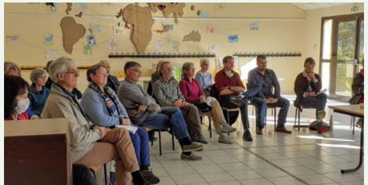
Les habitants ont abordé des thématiques très variées.

Le 16 octobre dernier, 19 habitants du village sont venus à la rencontre de leurs élus pour un temps d'échanges sur la commune, leur cadre de vie, les services proposés, les difficultés du quotidien. Ils ont pu aborder de multiples questions comme le passage à la redevance incitative du SMITOM, les transports scolaires, la fibre, les antennes de téléphonie mobile, le transport et le covoiturage, les incivilités routières, les cimetières, la diffusion de l'information dans les villages... Autant de questions pour lesquelles les élus ont pu apporter des réponses sur place ou pris des contacts pour faire suivre des informations par la suite.