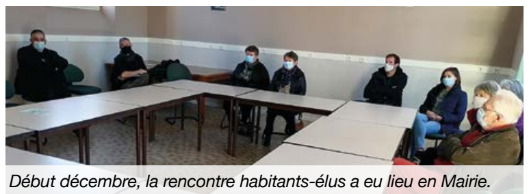
Début décembre, la rencontre habitants-élus a eu lieu en Mairie.

Après vauchrézien le 16 octobre, les élus de Brissac Loire Aubance étaient présents à Sauglé l'Hôpital le 4 décembre pour une rencontre avec les habitants qui s'est tenue dans la mairie déléguée. Les thématiques abordées ont été très variées avec notamment des questions sur la redevance incitative mise en place par le SMITOM à compter de ce début 2022.