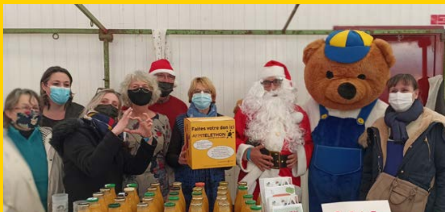
La vente de soupes par le CCAS a permis de collecter 284 € pour le téléthon.

Les P'tits soleils de fin d'année ont largement brillé en décembre. Environ 210 boîtes réalisées par les habitants, les familles de collégiens, les enfants des écoles primaires, les salariés d'entreprise, l'EHPAD... ont été collectées afin d'être offertes aux résidents de Perce-Neige et aux bénéficiaires de l'aide alimentaire ainsi que les enfants et jeunes vivant dans les foyers gérés par le département. Les boîtes ont été collectées dans les mairies, à France Services, sur le marché de Noël mais aussi à l'auto-école La Bonne Conduite, de nouveau mobilisée cette année pour proposer un autre point de collecte.