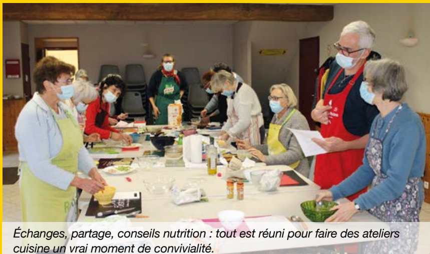
Échanges, partage, conseils nutrition : tout est réuni pour faire des ateliers cuisine un vrai moment de convivialité.

Inscriptions auprès du CCAS au 02 41 91 74 08.