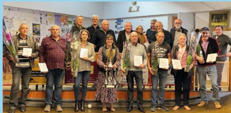
Les élus ont récompensé les lauréats du nouveau challenge 2021.

Faire découvrir la boule de fort et son patrimoine aux habitants de Brissac Loire Aubance : voici l'objectif du nouveau challenge créé en 2020 mais qui, Covid oblige, a dû attendre octobre 2021 pour connaître son épilogue. Pour ce challenge «découverte», les équipes devaient être composées de 2 personnes, avec au moins un non-joueur, homme, femme ou enfant de plus de 7 ans. Les engagements étaient gratuits pour la première série afin de ne pas faire payer les équipes débutantes et d'ouvrir le challenge de façon ludique à toute personne désirant essayer le jeu de boule de fort qui se joue en chaussons. Au total, 88 concurrents étaient inscrits. Les éliminatoires se sont joués dans tous les jeux de la commune, avant les séries et les demi-finales et finales qui ont eu lieu samedi