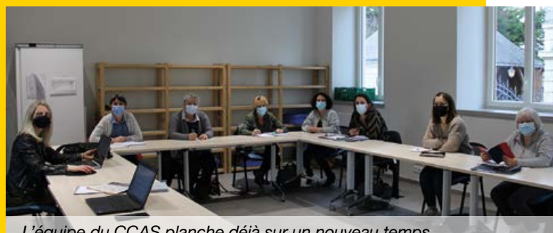
L'équipe du CCAS planche déjà sur un nouveau temps festif qui sera proposé au printemps.

En raison de la situation sanitaire difficile liée à la Covid en ce début d'année, l'équipe du CCAS a choisi de reporter les après-midis «Galette festive» dédiés aux seniors qui étaient prévus en janvier/février. Une nouvelle thématique sera proposée pour ces après-midis festifs qui devraient être organisés au printemps prochain dès que la situation sanitaire le permettra. Soyez assurés de la mobilisation de l'équipe du CCAS pour organiser un moment festif en 2022 et maintenir un temps de rencontre pour les aînés, du lien, tout en maintenant la proximité.