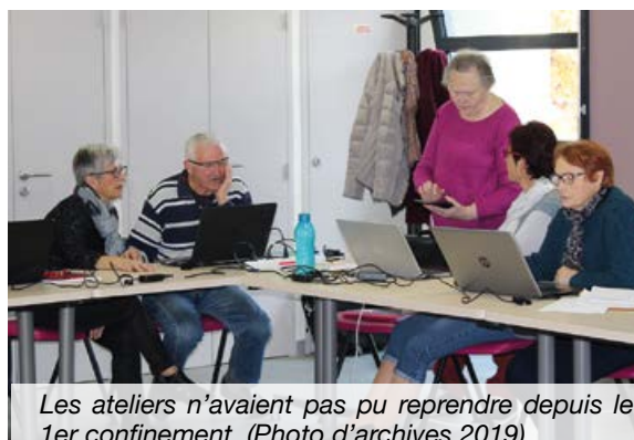
Les ateliers n'avaient pas pu reprendre depuis le 1er confinement. (Photo d'archives 2019)

Les ateliers numériques reprennent du service dès le 11 janvier, les mardis à la salle des associations de Charcé-Saint-Ellier. Ces ateliers animés par des personnes ressources bénévoles proposent de se familiariser ou de progresser dans le domaine de l'informatique et du numérique. Le nombre de places est limité à 6 personnes. N'oubliez pas de vous inscrire et d'apporter votre PC.