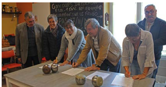
La convention de l'Union de Chauvigné a été signée le 13 octobre dernier.

La société intègre ce label dans ses statuts et en informe la Préfecture. Société privée, elle est ainsi en règle sur le plan administratif pour recevoir tout groupe non sociétaire pour des événements familiaux, puisqu'elle est le seul lieu disponible. La société « Cœur de Village » se trouve de ce fait renforcée dans sa vocation de lieu de rencontre, parti-