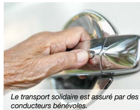
Le transport solidaire est assuré par des conducteurs bénévoles.

- Renseignements ou si vous souhaitez devenir bénévole : CCAS au 02 41 91 74 08 ou par mail : ccas@brissacloireaubance.fr