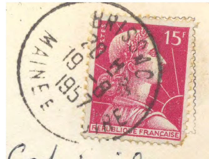
Chemellier vue aérienne écrite en 1957 et timbrée 15f Liberté de Gandon (Editions LAPE)