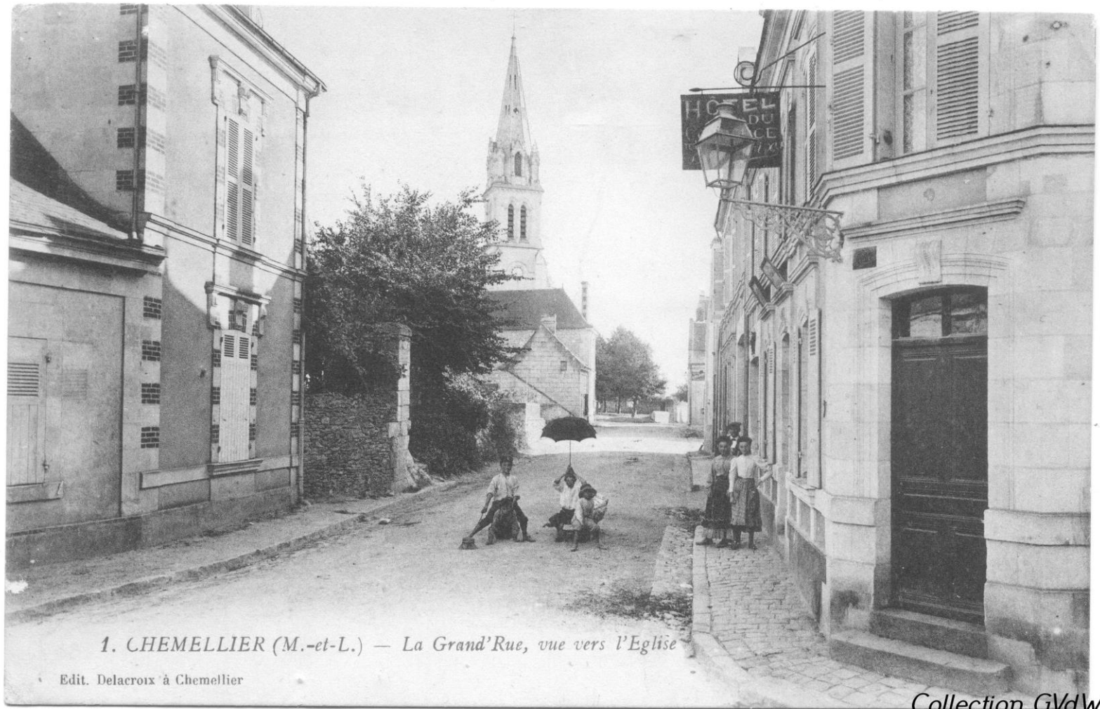
1. CHEMELLIER (M.-et-L.) — La Grand'Rue, vue vers l'Eglise