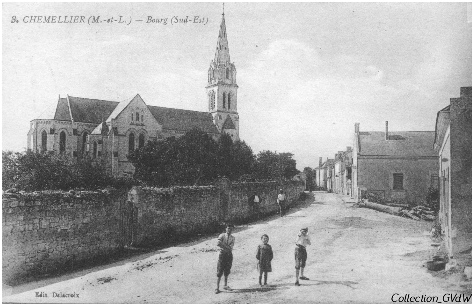
Vers 1910 - A droite le 19 rue des tilleuls (Route de Grésillé) (carte Ed. Delacroix n°3)