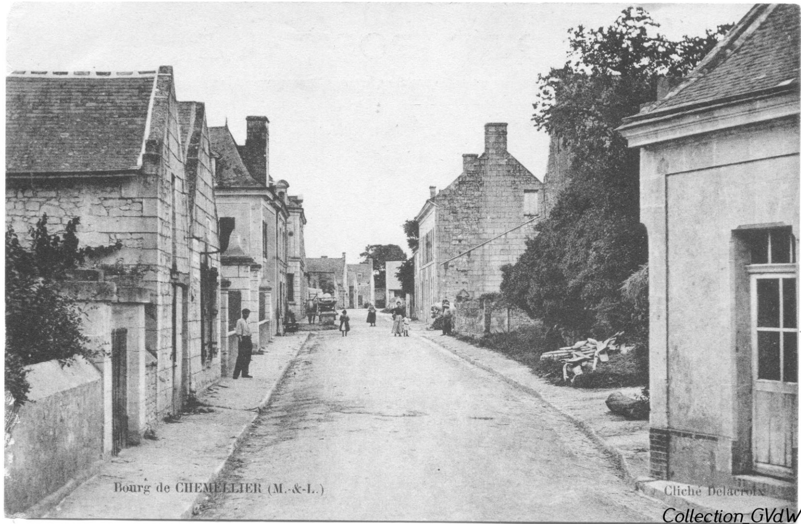
Avant 1910 - Le 39 rue H. Bouriché à droite (Grande Rue à l'époque)