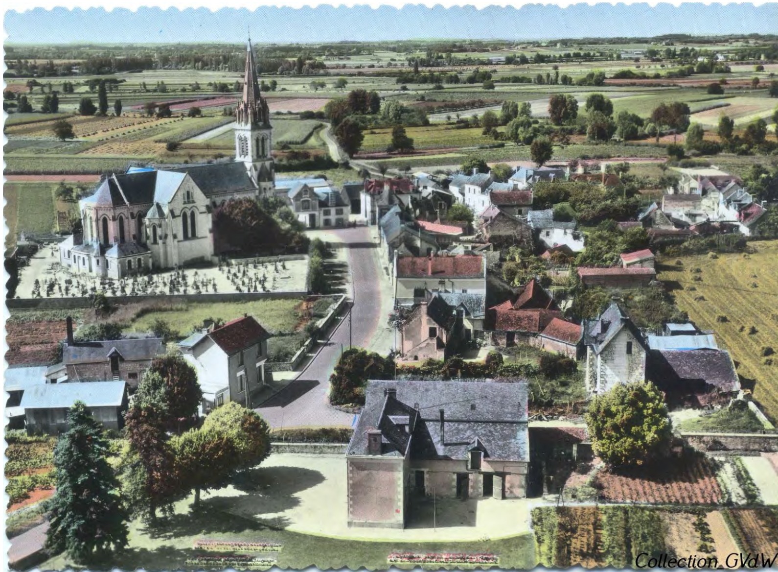
Chemellier vue aérienne vers 1970 – La rue des Tilleuls, le 23 à droite au premier plan et la Boulangerie à gauche