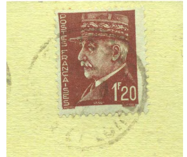
Vers 1940 timbrée Pétain 1 fr20 – 32 Rue H. Bouriché anciennement Grande Rue ou route de St Mathurin (carte Ed. Artaud - Nantes)