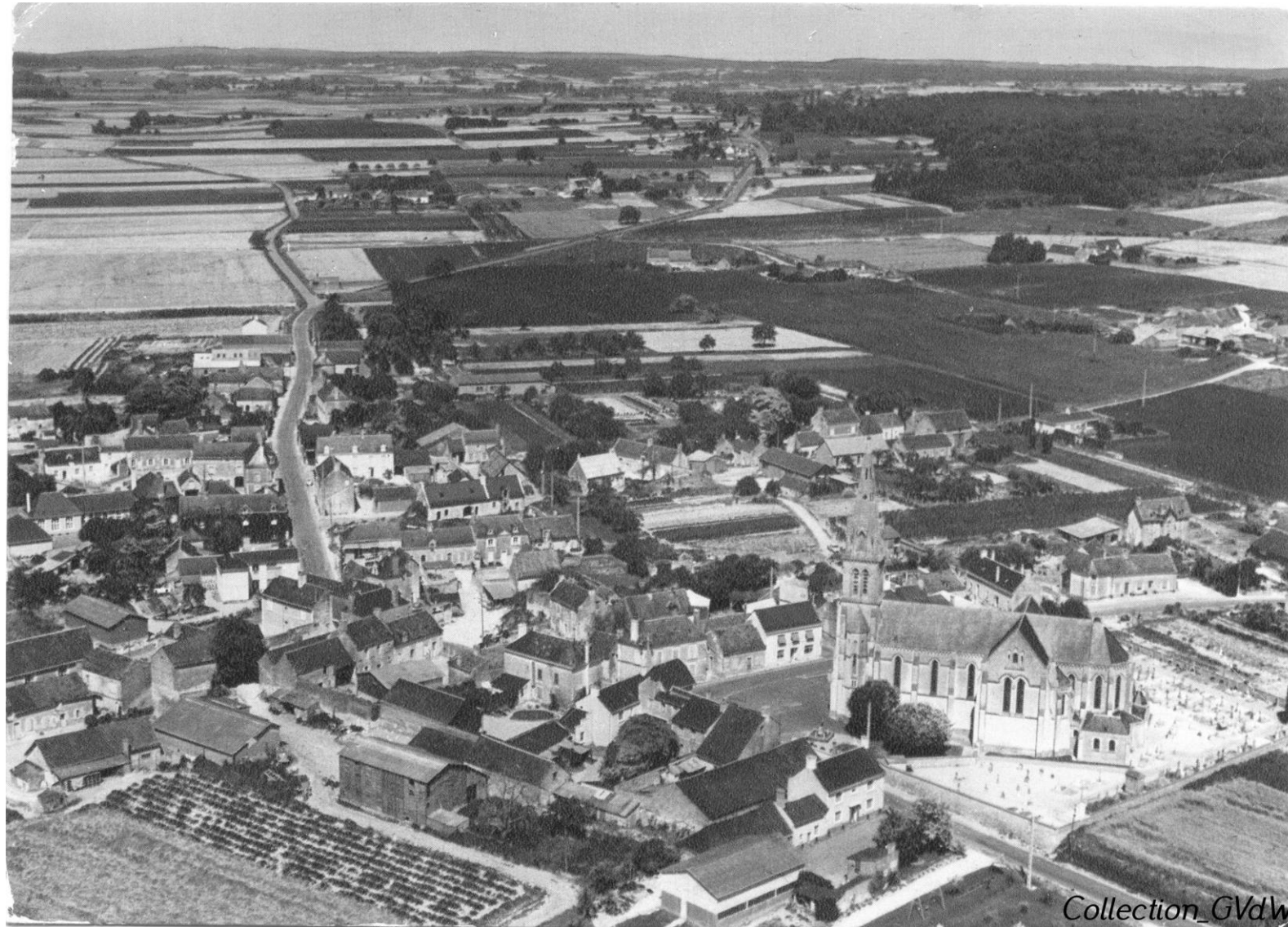
Chemellier en avion – Ecrite en 1957 et timbrée 15f Marianne de Muller