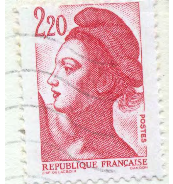
Chemellier vue générale aérienne – Ecrite en 1989 et timbrée 2.2 f Liberté de Gandon