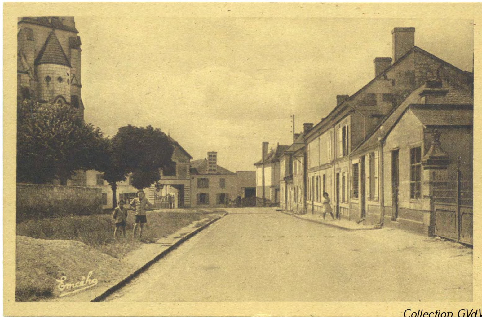
Vers 1960 – (A droite le 15) Rue des Tilleuls alors route de Grésillé (carte Ed. Chrétien - Angers)