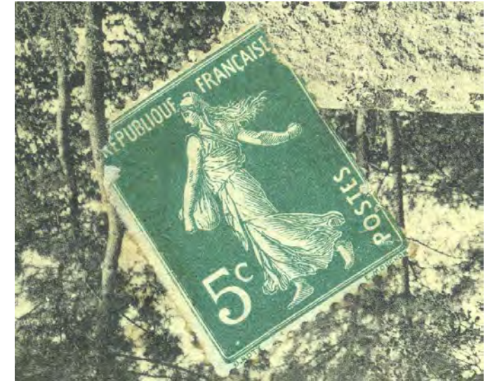
Ecrite en 1914 & timbrée la semeuse 5c . Le dolmen (dit Pierre Couverte) (carte Ed. L.V.)