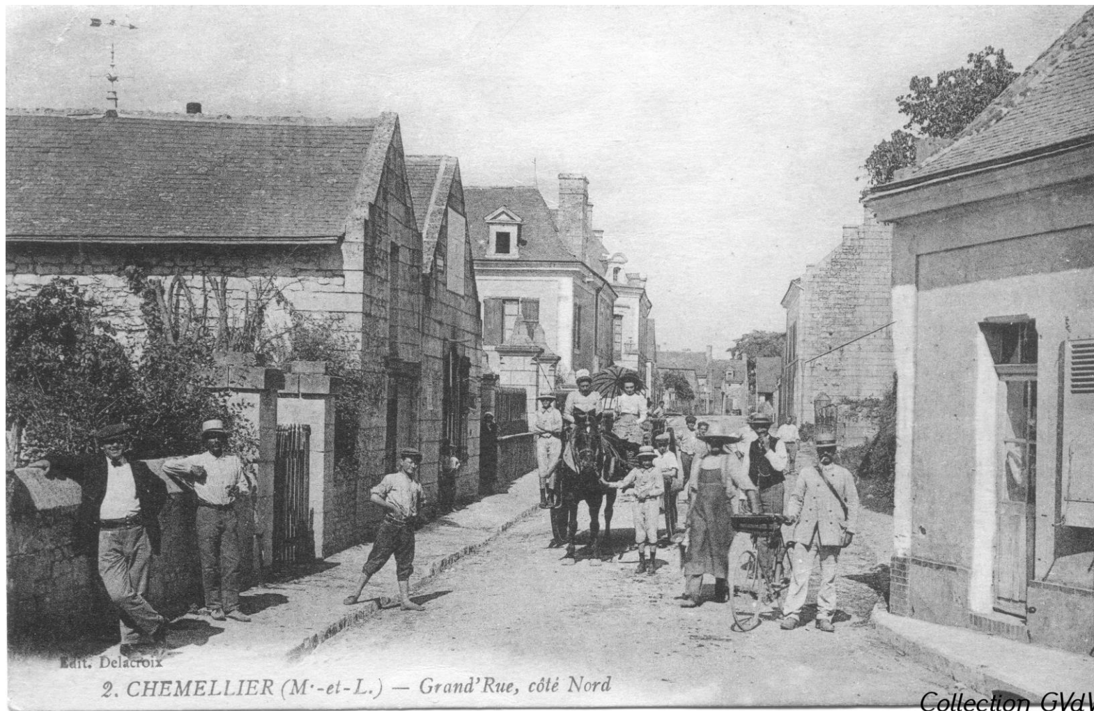
Vers 1910 – A droite le 39 rue H. Bouriché (Grande Rue à l'époque) (carte Ed. Delacroix n°2)