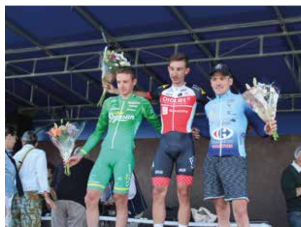
Les lauréats de cette 5 ème édition du Tour.

Une belle fête sportive et festive : voilà qui résume l'ambiance sur les routes de la 5 ème édition du Tour de Brissac Loire Aubance, course cycliste interrégionale au départ de Saulgé l'Hôpital qui a eu lieu le 29 mai dernier 2022. Ce tour de 130 kilomètres qui passe dans tous les villages était organisé conjointement par la commune et Angers Métropole Cyclisme 49. Il servait cette année encore de support au championnat départemental