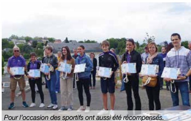
Pour l'occasion des sportifs ont aussi été récompensés.

Cette inauguration a aussi été l'occasion de mettre en valeur les sportifs qui ont fait rayonner Brissac Loire Aubance au cours de l'année. Des jeunes présidents de club ont été récompensés pour leur engagement associatif, les sports de ballon (voir ci-contre) ont aussi reçu un trophée pour