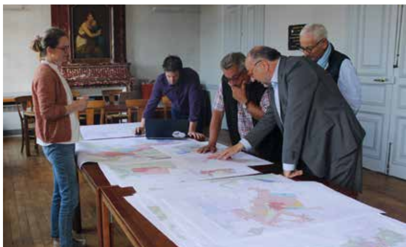
Des rendez-vous individuels ont été organisés pour permettre aux habitants d'avoir des informations sur mesure sur leur terrain.

L'ensemble des documents en lien avec la préparation du nouveau Plan Local d'Urbanisme sont disponibles sur la page dédiée de notre site Internet www.brissacloireaubance.fr/le-nouveau-plan-local-durbanisme-en-preparation/