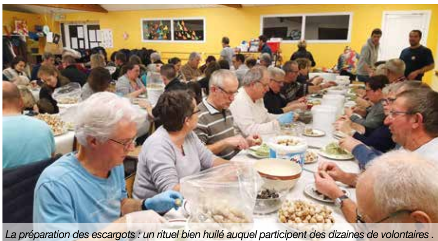
La préparation des escargots : un rituel bien huilé auquel participent des dizaines de volontaires .