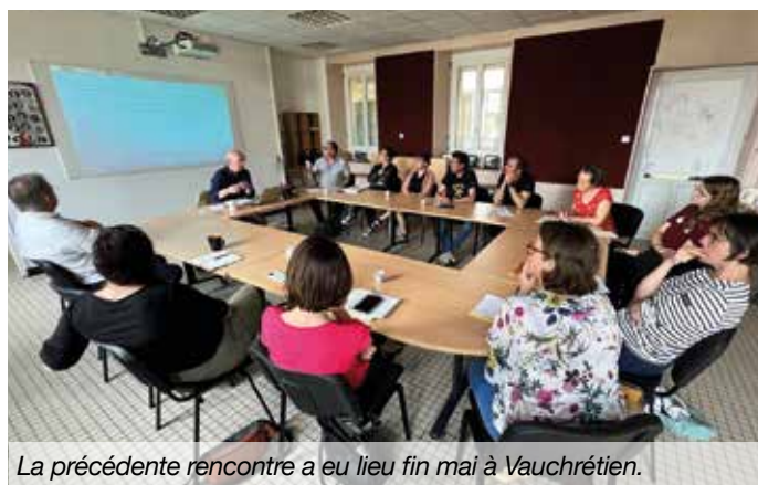
La précédente rencontre a eu lieu fin mai à Vauchrézien.

Après un rendez-vous fin mai à Vauchrézien sur le thème des conditions générales de vente, un nouveau café-rencontre des entrepreneurs est organisé par la commission vie économique de la commune. Il a été fixé au vendredi 30 septembre de 8h30 à 10h . Il portera sur :