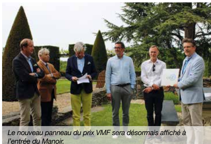
Le nouveau panneau du prix VMF sera désormais affiché à l'entrée du Manoir.

Les jardins du Manoir de la Groye regroupent différents espaces : un arboretum dans la partie haute, un jardin régulier avec sa terrasse et une pergola qui entoure le manoir. En contrebas, une