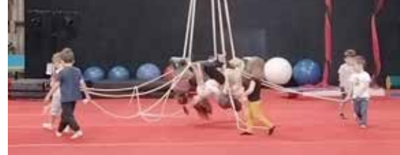
Une découverte pour les enfants.

Les écoles du regroupement de Chemellier, Coutures et St-Rémy-la-Varenne ont mené un projet autour des activités circassiennes à l'école des arts du Cirque la Carrière à Saint-Barthélémy-d'Anjou pendant quatre semaines. Les élèves ont pu s'initier aux quatre domaines des arts du cirque (aériens, jonglante, acrobatie, équilibre sur objet) en étant acteurs et aussi spectateurs actifs et attentifs. Une initiation aux arts du spectacle vivant où chacun s'est investi, dépassé. Cela a permis de mobiliser et d'enrichir leur imaginaire en transformant leur façon usuelle d'agir et de se déplacer, en utilisant un nouvel usage du corps. Les élèves se sont ensuite produits devant les familles où tous ont pu apprécier une expression poétique du mouvement, leur spectacle a été suivi d'une représentation de professionnels des arts du cirque.