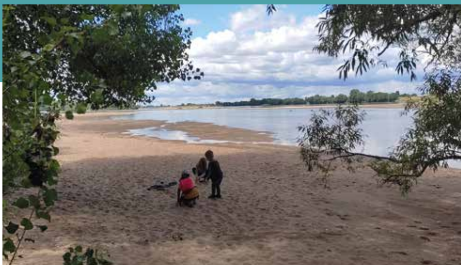
La boucle passe sur les plages des bords de Loire.

Le vignoble angevin est définitivement une terre de randonnée. Quand la randonnée s'étend sur les bords de Loire, elle devient sublime ! Ce trimestre, c'est un circuit de découverte de la Vallée de la Loire à Saint-Rémy-la-Varenne qui vous est proposé. En famille ou entre amis, à pied ou à vélo, parcourez le sentier de randonnée balisé de la Boucle de la Loire de Saint-Rémy-la-Varenne, à la découverte du paysage ligérien. Sur