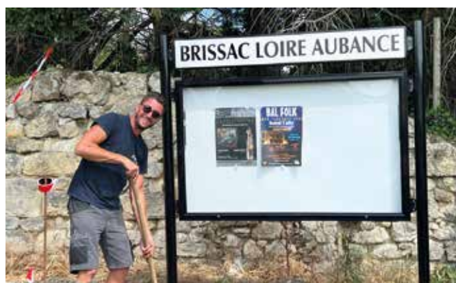
Les 14 vitrines d'information ont été installées en juin.

Des vitrines d'affichage ont été posées dans tous les villages afin d'apporter des informations à tous les habitants et visiteurs, notamment ceux qui n'ont pas accès aux services numériques dans la commune. Au total, 14 vitrines ont été installées. Destinées en priorité à recevoir l'affichage des manifestations organisées par Brissac Loire Aubance ou en partenariat avec la commune, elles seront accessibles aux associations ou organisateurs de manifestations culturelles sur simple dépôt des affiches à la mairie de Brissac Loire Aubance, au moins deux semaines avant la date de l'événement, en 18 exemplaires.