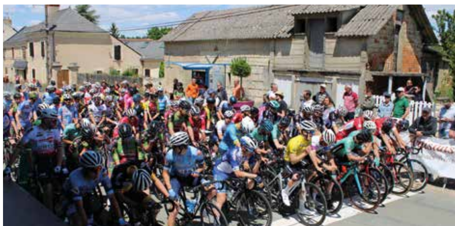
De très bonnes équipes étaient alignées au départ du Tour.