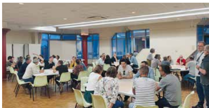
La réunion a permis de donner la parole aux participants sur les différentes questions à venir.

Avec le retour de l'ensemble des équipements sportifs en gestion communale au 1 er janvier 2023, les élus de la commission sports et vie associative ont souhaité lancer une concertation avec les habitants en général et les utilisateurs de ces équipements en particulier. Plus d'une soixantaine de personnes ont ainsi répondu présents à cette invitation à la réflexion dont le premier rendez-vous était fixé le 16 mai à la salle du Tertre à Brissac-Quincé. Après une présentation générale du contexte de retour de ces équipements jusqu'alors intercommunaux en gestion communale, les participants ont été invités à plancher sur les améliorations