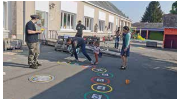
Le travail des parents pour divertir les enfants.

C'est une belle équipe de parents enthousiastes qui se sont mis au travail, un samedi matin de la fin avril pour créer de nouvelles activités dans la cour de l'école maternelle de Coutures. La mairie a fourni le matériel et les parents et enseignants ont réalisé les peintures au sol, très colorées, au moyen de pochoirs. Une démarche identique a été mise en œuvre dans la cour de l'école de Chemellier. Bravo aux valeureux peintres et merci pour leur implication qui permet de rendre l'école toujours plus agréable pour les enfants.