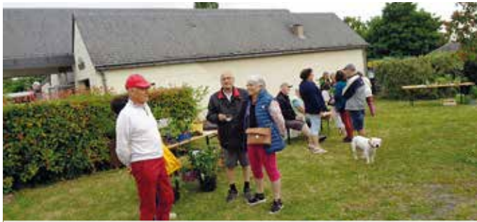
Le plaisir de se retrouver et d'échanger autour du jardin.

Organisé le 22 mai dernier, le Troc Plantes a réuni bon nombre d'amateurs de jardinage dans le centre bourg de Coutures. Au programme : des échanges de plants et autres boutures mais surtout le partage de bons conseils pour les plus novices et de trucs et astuces pour les plus aguerris. Un moment simple et convivial autour du plaisir de «faire pousser».