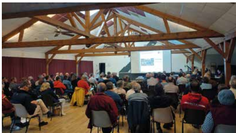
La présentation du plan de zonage a réuni de nombreux habitants, le 23 mai.

Après cette première présentation générale, une présentation dédiée aux agriculteurs a été organisée le 30 mai à la salle du ruau à Charcé afin d'échanger avec eux plus précisément sur les limites entre zones agricoles et zones à urbaniser. Au mois de juin, trois demi-journées sur rendez-vous ont permis aux habitants propriétaires