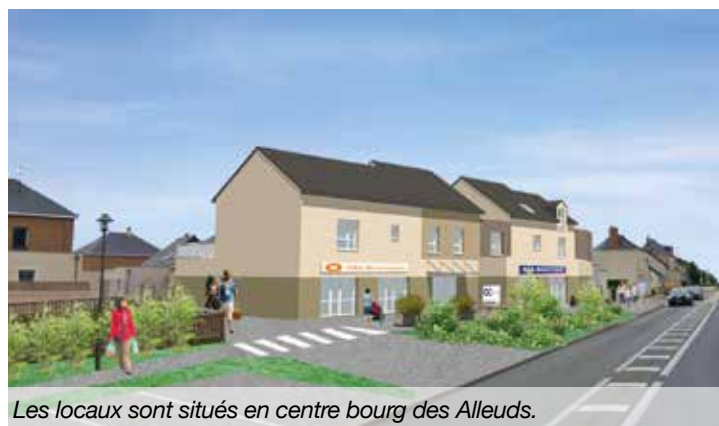
Les locaux sont situés en centre bourg des Alleuds.

Contact : Maine-et-Loire Habitat - Service clientèle : 02 41 81 68 30 et infos sur www.maineetloire-habitat.fr/