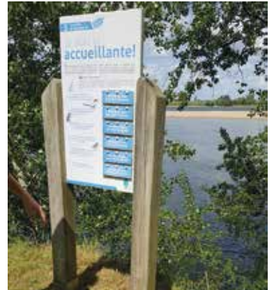
Les anciens panneaux vont être remplacés.

nature, plus proche des attentes actuelles des visiteurs : un panneau de départ et 4 stations thématiques sur la faune et la flore de bord de Loire, les caractéristiques des boires, les inondations de la Loire. Les illustrations occuperont une grande partie des panneaux en lave émaillée garantie à vie sur des supports en bois d'acacia imputrescible. Ce sentier qui sera pérenne grâce aux matériaux utilisés, est porté par le P.N.R. Loire Anjou Touraine. La commune financera 20% du projet et le Parc 80% sur un budget total de 24 400 € HT.