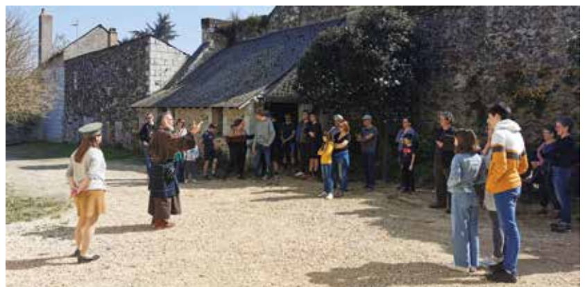
Les murder-partys et enquêtes au Prieuré attirent toujours un large public.

De nombreux temps forts de Polarisez-vous ont été organisés en mai et juin et ont réuni un public désormais fidèle. Enquête, conférence, murder-party, rencontre d'auteurs, lecture musicale, expositions... il y en avait pour tous les goûts !