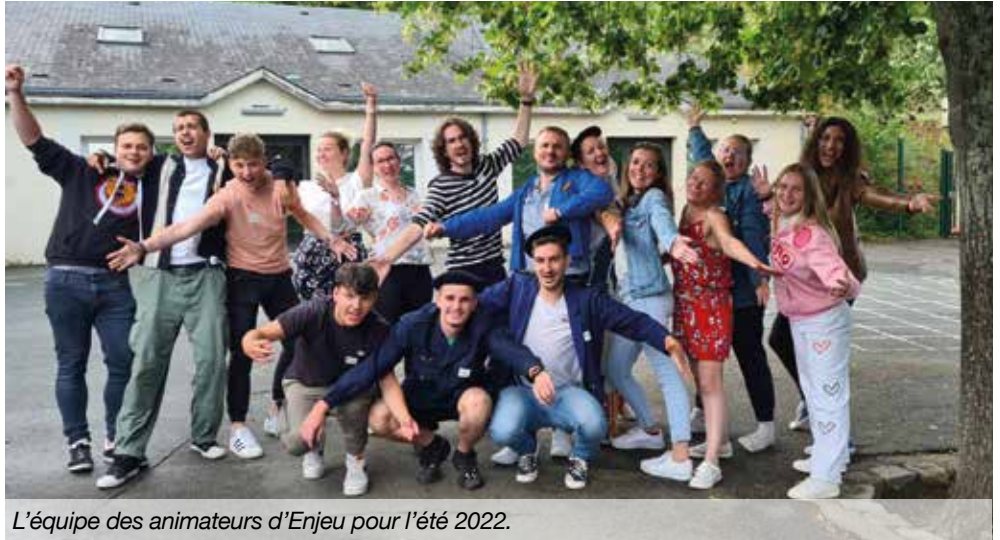
L'équipe des animateurs d'Enjeu pour l'été 2022.