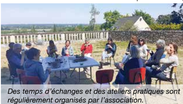
Des temps d'échanges et des ateliers pratiques sont régulièrement organisés par l'association.

et une page Facebook : L'Atelier citoyen 49