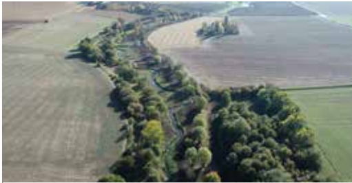
Le pont des Buttes et ses méandres, un patrimoine paysager à re-découvrir.