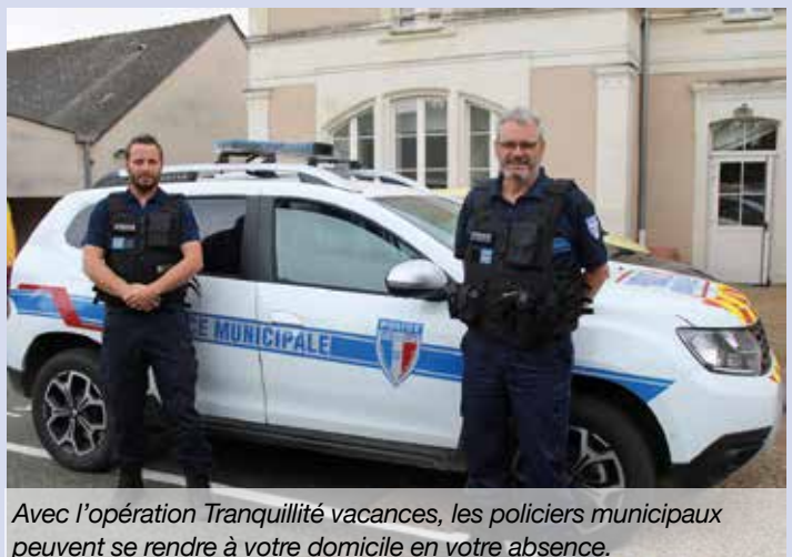
Avec l'opération Tranquillité vacances, les policiers municipaux peuvent se rendre à votre domicile en votre absence.

www.brissacloireaubance.fr/la-police-municipale/