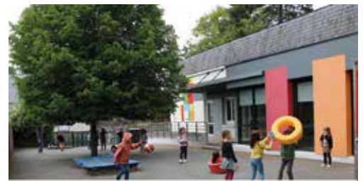
Le PEDT s'appliquera dans le cadre scolaire et périscolaire.

Pour consulter le livret de présentation du PEDT dans son intégralité flashez le code, ou rendez-vous sur le site, rubrique vie pratique, scolaire.