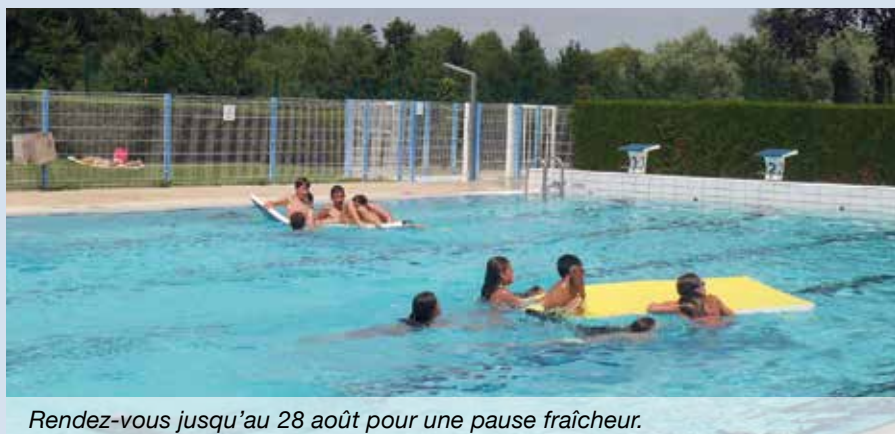
Rendez-vous jusqu'au 28 août pour une pause fraîcheur.

Téléphone de la piscine (en saison) : 02 41 91 23 32.