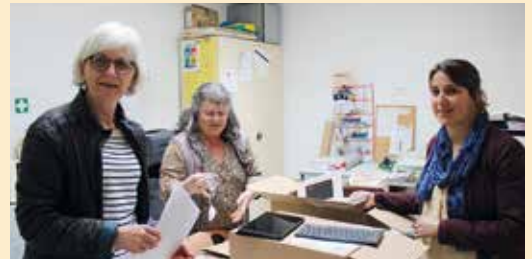
La remise du matériel à l'école de St-Rémy.

contenu interactif. La commune consacre un budget de 80 000 € sur 4 ans pour ces équipements et leur maintenance.