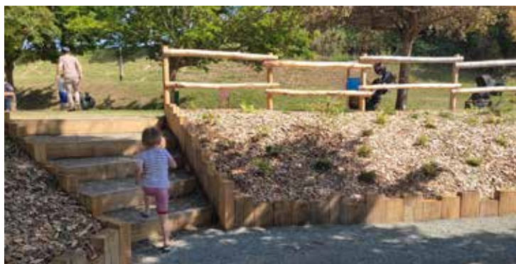
Le nouvel aménagement.

Le long de l'Aubance, à Brissac-Quincé, le parc de jeux est bien connu des enfants. Il a bénéficié ce printemps d'un petit relooking.