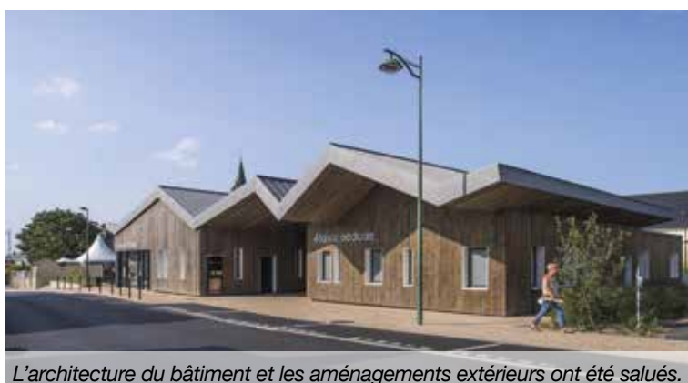
L'architecture du bâtiment et les aménagements extérieurs ont été salués.