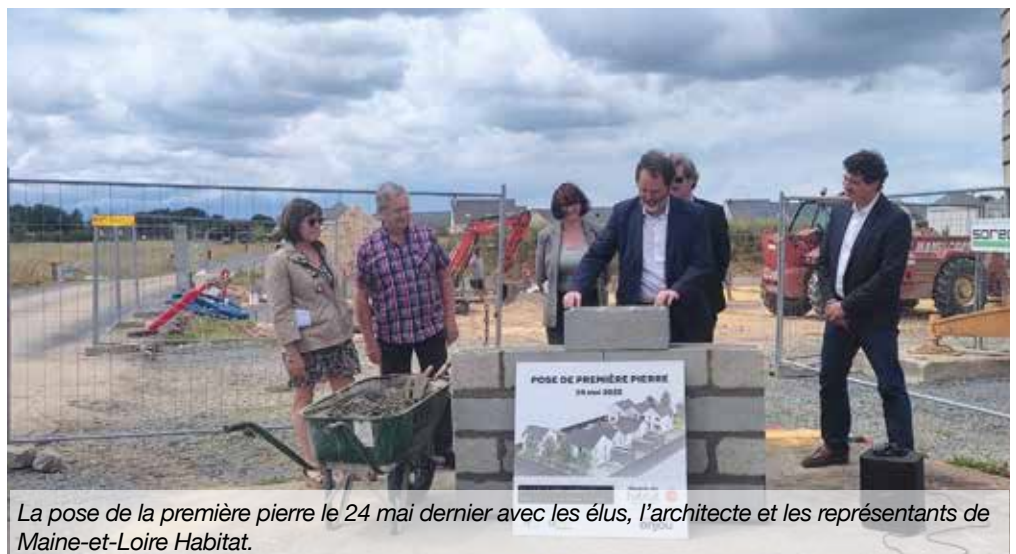
La pose de la première pierre le 24 mai dernier avec les élus, l'architecte et les représentants de Maine-et-Loire Habitat.

Agence Commerciale ALTER – Espace Boselli – ANGERS.