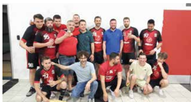
Les joueurs de l'ESA hand heureux de cette montée en régionale.

Retrouvez aussi ces clubs sur leurs pages Facebook ! Bravo à l'ensemble des joueurs pour ces magnifiques résultats qui ont été honorés lors du forum des associations par la remise d'un trophée.